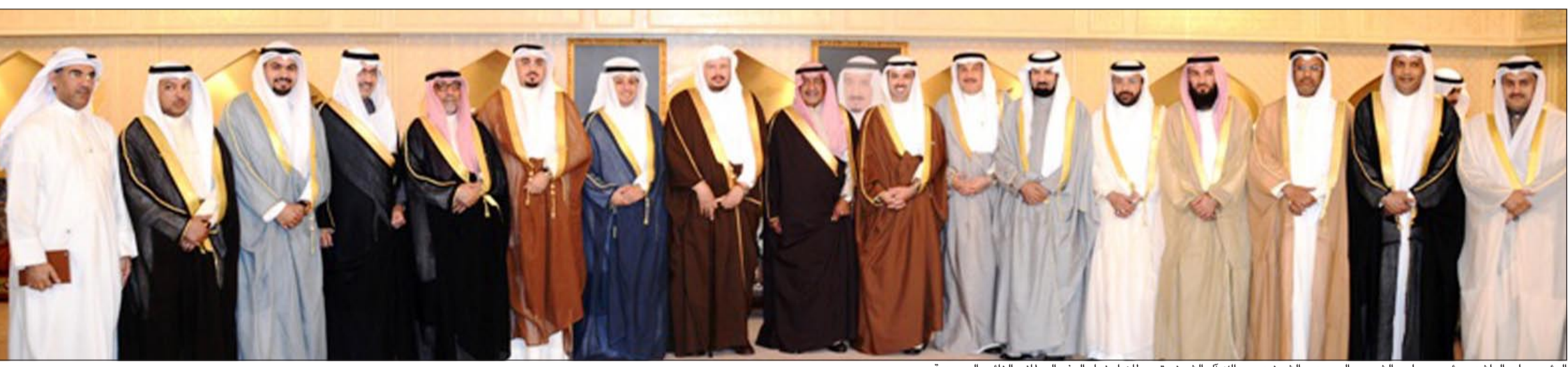
الرئيس علي الراشد ورئيس مجلس الشورى السعودي الشيخ د. عبدالله آل الشيخ يتوسطان أعضاء الوفد البرلماني الزائر بالسعودية

كتب موفد مجلس الأمة عايض البرازي: استقبل سمو ولي العهد ونائب رئيس مجلس الوزراء ووزير الدفاع في المملكة العربية الشقيقة صاحب السمو الملكي الأمير سلمان بن عبدالعزيز آل سعود رئيس مجلس الأمة علي الراشد والوفد المرافق له، وجرى خلال اللقاء بحث العلاقات الثنائية بين البلدين الشقيقين وسبل تعزيزها علاوة على بحث التطورات الإقليمية والدولية. حضر اللقاء النواب كامل العوضي وسعد البوص وخالد العودة ود.مشاري الحسيني وعصام الدبوس وبدر البذالي ومحمد الجبوري والأمين العام لمجلس الأمة عدلام الكندي وسفيرنا لدى المملكة العربية السعودية الشيخ ثامر جابر الأحمد. كما التقى الراشد بالنائب الثاني لرئيس مجلس الوزراء