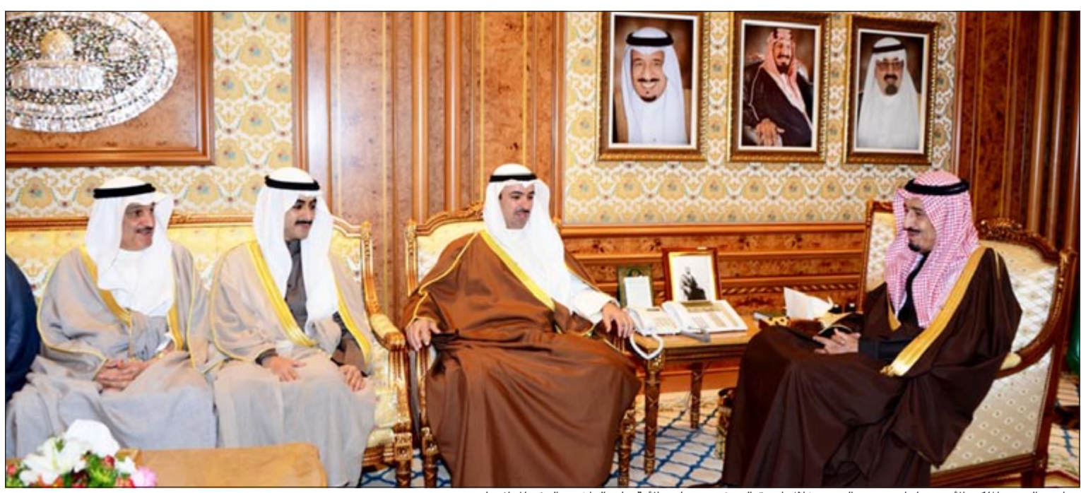
صاحب السمو الملكي الأمير سلمان بن عبدالعزيز خلال استقبله رئيس مجلس الأمة علي الراشد والوفد المرافق له