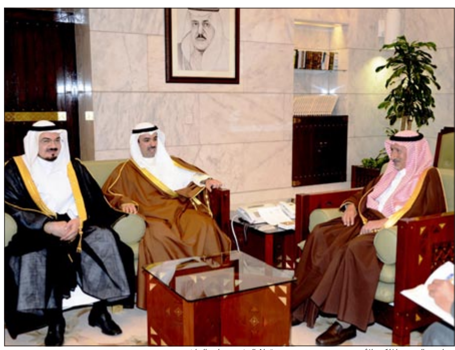
صاحب السمو الملكي الأمير محمد بن سعد مستقبلاً الرئيس علي الراشد