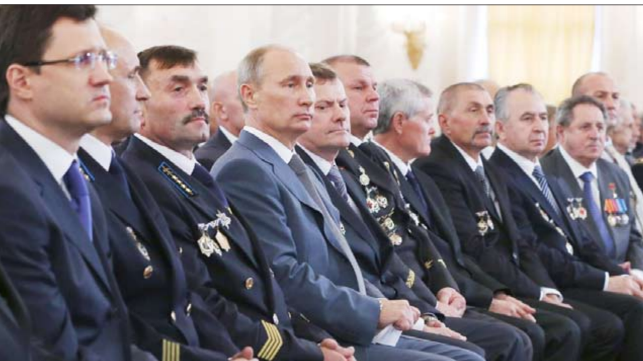
الرئيس الروسي فلاديمير بوتين خلال اجتماعه مع عمال المناجم في الكرملين امس (أ.ب)

موسكو - أ.ش.أ - رويترز: أفاد استطلاع جديد للرأي أجراه مركز «لفباد» الروسي المستقل بأن شعبية الرئيس الروسي فلاديمير بوتين سجلت أدنى مستوى لها منذ إعادة انتخابه رئيساً للبلاد في شهر مارس الماضي. وأوضح الاستطلاع أن أقل من نصف المواطنين الروس (48٪) أبدوا موافقتهم على أداء الرئيس بوتين، وهي نسبة تقل بواقع 12٪ عن المؤيدين له في آخر استطلاع أجري في مايو الماضي، فيما زاد عدد غير الراضين عن أدائه إلى 25٪ من المشاركين. وتعكس نتائج الاستطلاع وفقاً لوكالة أنباء «نوفوستي» الروسية أكبر هبوط في شعبية بوتين كرئيس منذ توليه منصبه حيث كانت نسبة المؤيدين له خلال فترتي رئاسته الأولى 65٪ في المتوسط والمعارضين نحو 15٪. تجدر الإشارة إلى ان شعبية بوتين وصلت إلى أدنى مدلاتها على الإطلاق في شتاء 2005 مسجلة 55٪ نتيجة تطبيق برنامج لتقليص الخدمات الاجتماعية، فيما سجلت أعلى مدلاتها في نهاية 2008 بنسبة 88٪.