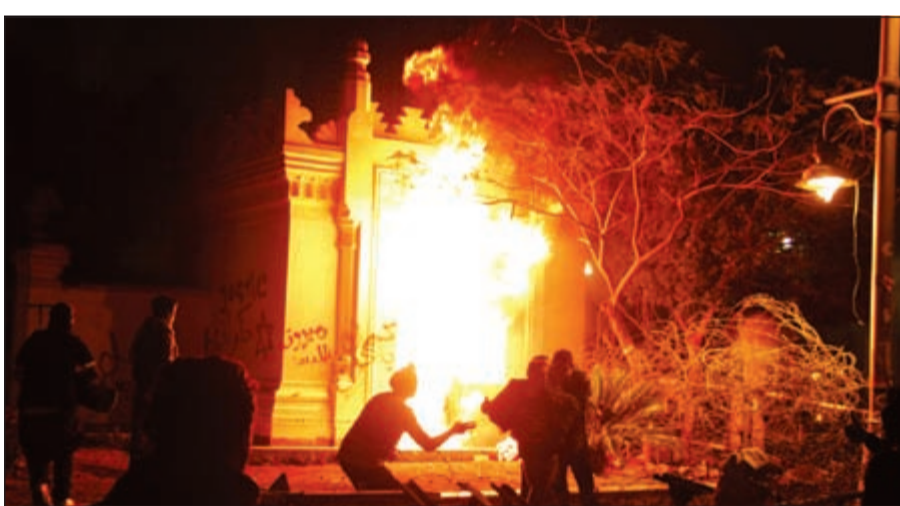
جزء من سور قصر الاتحادية الرئاسي اشتعل بالنيران بعد رشقه بالمولوتوف من قبل المحتجين أمس

القاهرة - وكالات: فيما رشق المحتجون امس قصر الاتحادية الرئاسي بقنابل بزين حارقة «مولوتوف» متسببين باشتعال سور بالنيران، تجمع الآلاف في ميدان التحرير بالقاهرة وفي العديد من المحافظات رغم سوء الأحوال الجوية وتساقط الأمطار في «جمعة الخلاص من الإخسوان» للاحتجاج على حكم الرئيس محمد مرسي. وهدف المتظاهرون الذين امتلأ بهم ميدان التحرير وأمام قصر الاتحادية الرئاسي بعد صلاة الجمعة «أرحل، أرحل» وحملوا لافتات تطالب بـ «القصاص» للعشرات من ضحايا موجة العنف التي شهدتها البلاد في الأيام الأخيرة الماضية. وجرت تظاهرات مماثلة في مدن أخرى استجابة لدعوة جبهة الإنقاذ الوطني، الائتلاف الرئيسي للمعارضة. من جانبها، أعربت الرئاسة المصرية في بيان صحافي عن أسفها بأن المظاهرات «بدت» تخرج عن نطاق السلمية لتتلقى برجماتيات المولوتوف والعجوات الحارقة والشماريخ وتحاول الاقتحام بوابات القصر وتسلق أسواره». وذكرت الرئاسة أن «تلك الممارسات التخريبية العنيفة لا تمت بصلة إلى ميادئ الثورة