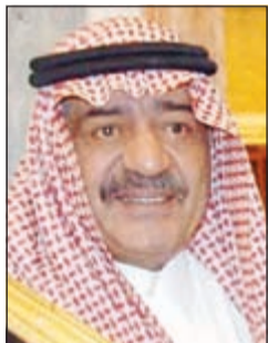
الأمير مقرن بن عبدالعزيز آل سعود