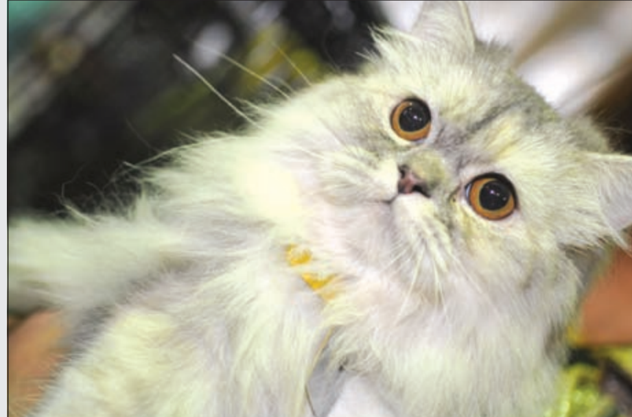
منافسة على أجمل قطة