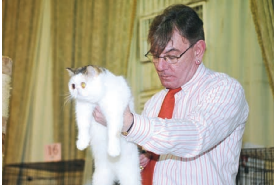
استعراض لاحدى القطط المتنافسة