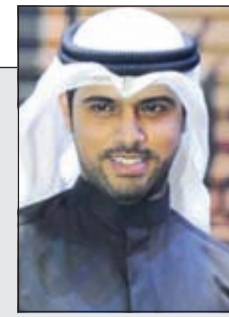
الروائي سعود السنعوسي