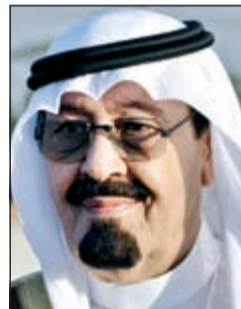
خادم الحرمين الشريفين الملك عبدالله بن عبدالعزيز

الرياض - وكالات: أصدر خادم الحرمين الشريفين الملك عبدالله بن عبدالعزيز أمس أمراً ملكياً بتعيين الأمير مقرن بن عبدالعزيز آل سعود المستشار والمبعوث الخاص لخادم الحرمين الشريفين نائباً ثانياً لرئيس مجلس الوزراء.