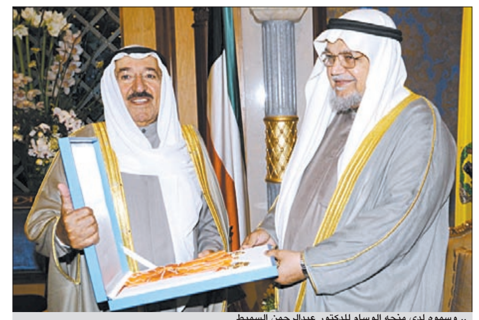
.. وسموه لدى منحه الوسام للدكتور عبدالرحمن السमित

منح صاحب السمو الأمير الشيخ صباح الأحمد رئيس الهيئة الخيرية الإسلامية العالمية السابق العم يوسف الحجى، ورئيس مركز دراسات العمل الخيري د.عبدالرحمن السमित «وسام الكويت ذو الوشاح من الدرجة الأولى» وذلك تقديراً لما قاموا به من جهود متميزة في خدمة الإسلام والمسلمين بمجال العمل الخيري التطوعي محلياً وعربياً ودولياً. كما منح صاحب السمو الأمير المدير العام للإدارة العامة للإطفاء اللواء جاسم المنصوري وساماً آخر على صدورهم.