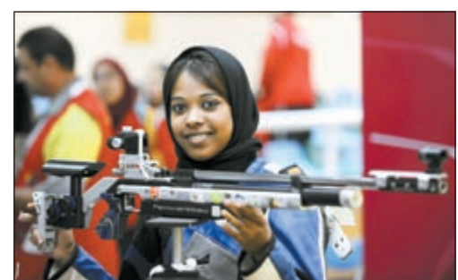
ذهبية ثانية لفرزوقي وفضية للتنس في دورة الألعاب العربية الـ 12 في الدوحة