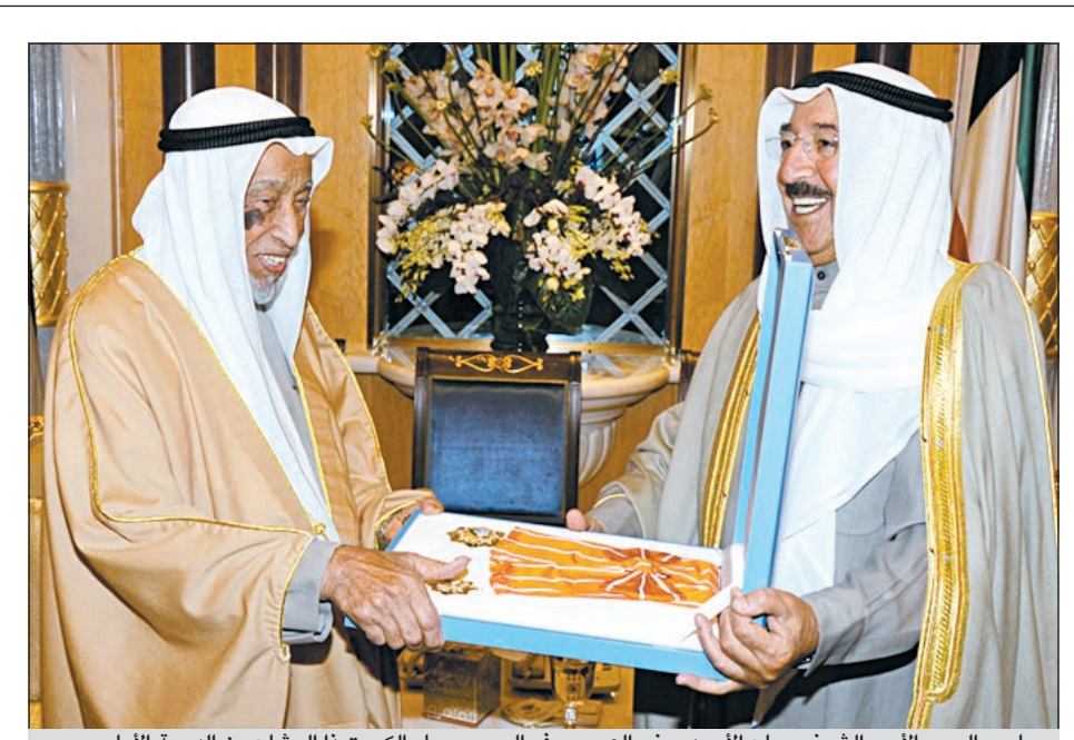
صاحب السمو الأمير الشيخ صباح الأحمد يمنح العم يوسف الحجى وسام الكويت ذا الوشاح من الدرجة الأولى

نفط الكويت تجمّد المفاوضات مع «إكسون موبيل» لتطوير حقول النفط الثقيل في شمال الكويت