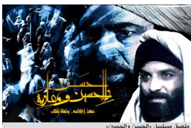
ملصق مسلسل «الحسن والحسين»

والحسين رضي الله عنهما حفيدي النبي محمد ﷺ ويسرد الاقتتال الذي حدث بين المسلمين على الخلافة الإسلامية بعد وفاة النبي محمد ﷺ. ولا يعرض هذا المسلسل سوى قناة عراقية واحدة هي «بغداد تي.في» خلال شهر رمضان. ويملك القناة حزب سني محافظ لديه عدد محدود من المقاعد في البرلمان، وحتى ليل السبت الماضي كان المسلسل يعرض لكن القناة المتفق عليه في نهاية العام. وعرضه حتى إشعار آخر. وأطلقت قناة بغداد تي.في حملة تطالب من المواطنين المشاركة في تصويت حول ما إذا كانت تستأنف عرض المسلسل الذي تعرض كل حلقة منه قائمة بالمؤسسات الدينية والشخصيات الدينية من السنة والشيعة التي وافقت على محتوى المسلسل.