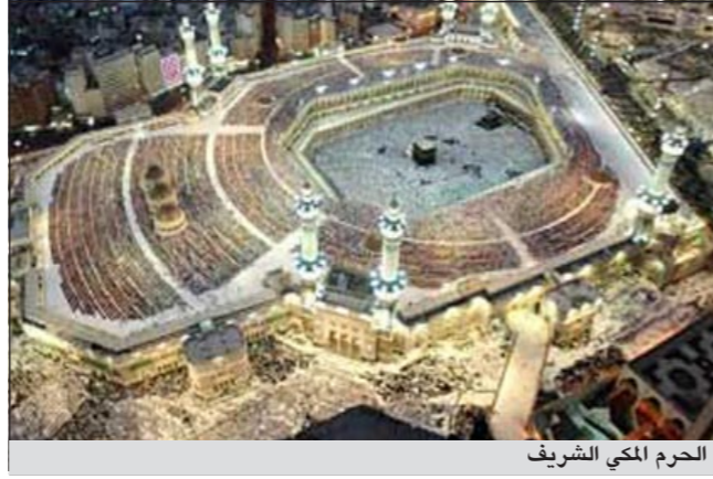
الحرم المكي الشريف

جدة - كونا: يضع خادم الحرمين الشريفين الملك عبدالله بن عبدالعزيز غدا الجمعة حجر الأساس لمشروع توسعة المسجد الحرام على مساحة تقدر بـ 400 ألف متر مربع. وذكر نائب الرئيس العام لشؤون المسجد الحرام د.محمد بن الخزييم في تصريح صحفي أن مشروع التوسعة في الناحية الشمالية من المسجد الحرام سيتم وفق أحدث وأرقى النظم، مضيفا أنها ستلبي جميع الاحتياجات والتجهيزات والخدمات الأساسية. وبين أن التوسعة الجديدة ستستوعب بعد اكتمالها أكثر من مليون ومائتي ألف مصلى تقريبا ويتم العمل فيها على تظليل الساحات الشمالية