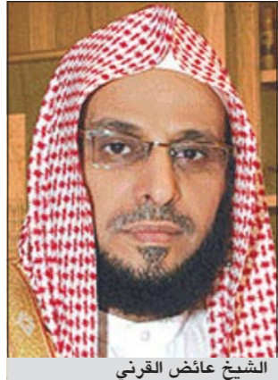
الشيخ ناصر العمر

تناقلت المواقع الإلكترونية مقطع «يوتوب»، هاجم فيه الشيخ ناصر العمر المشرف العام على مؤسسة ديوان المسلم، القائم على مسلسل «طاش ما طاش» ووصفهم بالمناقضين مثل الذين كانوا على عهد النبي ﷺ واستهزأوا بالله تعالى: (قل أسأله وآياته ورسوله كنتم تستهزئون). جاء ذلك في محاضرة نقلتها قناة «المسلم» بدأها الشيخ بوصف الممثلين في طاش ما طاش بـ «طاشة عقولهم»، وهم لا ينتقدون المتدينين كما يزعمون بل إنهم يتناولون على الدين ويستهزئون به من خلال تعرضهم للمشايخ والعلماء والقضاة بالتهكم والسخرية.