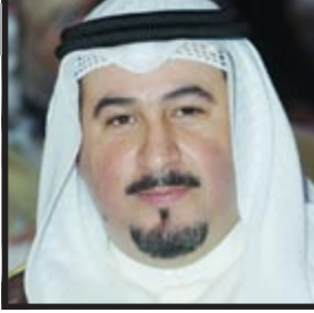
وداعاً سلطان الخير

بالأمس القريب فجعنا بوفاة ورحيل رجل لم يكن كباقي الرجال خصه الله سبحانه وتعالى بكثير من المناقب التي كانت خيراً على شعبه والمنطقة بأسرها. نعم هو صاحب السمو الملكي الأمير سلطان بن عبدالعزيز ولي العهد ورئيس مجلس الوزراء ووزير الدفاع والطيران والمفتش العام.