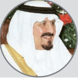
الشيخ فهد جابر العلي الصباح