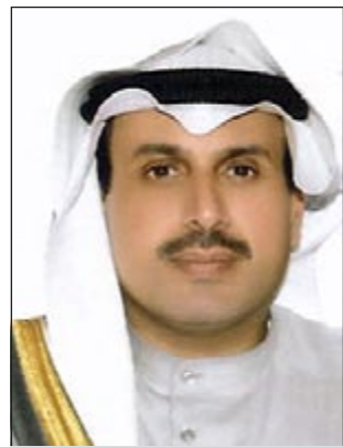
الشيخ حمد جابر العلي

كما أثنى الشيخ حمد بن جاسم رئيس مجلس الوزراء ووزير الخارجية القطري على الفقيد، منوها بحكمته برحمته الله في النقاش وصدوره المفتوح ودوره الكبير في التقارب القطري - السعودي ودوره في القضايا