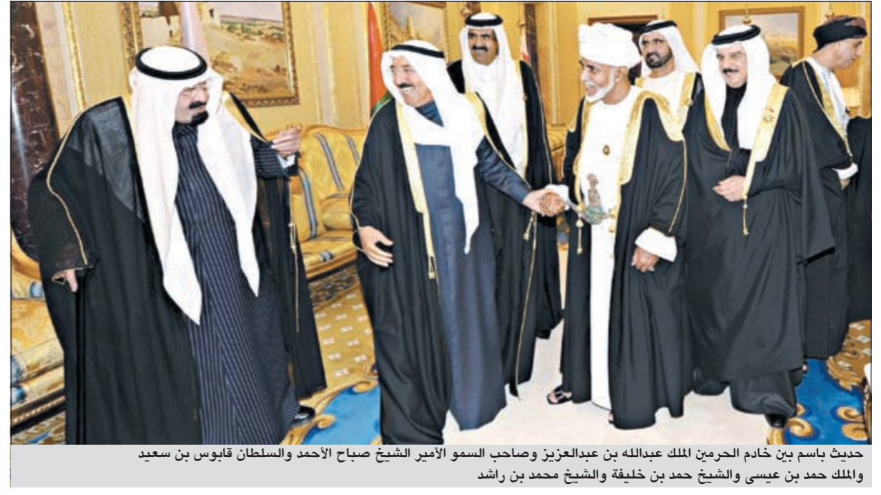
حديث باسم بين خادم الحرمين الملك عبدالله بن عبدالعزيز وصاحب السمو الأمير الشيخ صباح الاحمد والسلطان قابوس بن سعيد والملك حمد بن عيسى والشيخ حمد بن خليفة والشيخ محمد بن راشد

الرياض: عقب الجلسة الافتتاحية لقمة التعاون الـ 32 في الرياض عقد خادم الحرمين الشريفين الملك عبدالله بن عبدالعزيز آل سعود وإخوانه أصحاب الجلالة والسمو قادة ورؤساء وفود دول مجلس التعاون لدول الخليج العربية جلسة عملهم المغلقة مساء أمس بقصر الدرعية في الرياض، وذلك في إطار أعمال الدورة الثانية والثلاثين للمجلس الأعلى لمجلس التعاون لدول الخليج العربية.