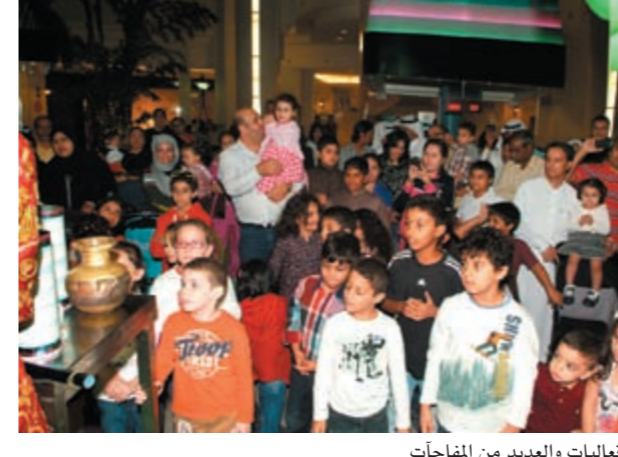
فعاليات والعديد من المفاجآت