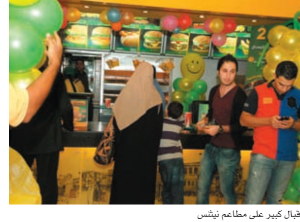
إقبال كبير على مطاعم نيثنس