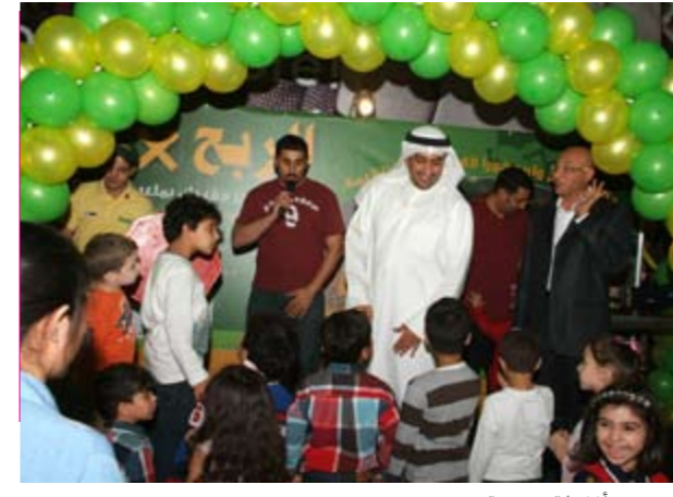
عروض وأنشطة ترفيهية