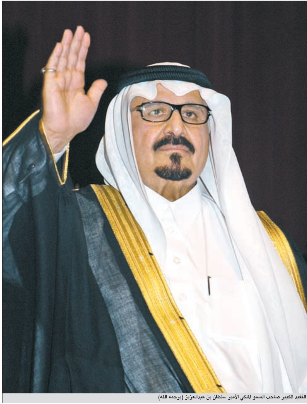
الملك الكبير صاحب السمو الملكي الأمير سلطان بن عبدالعزيز (برحمه الله)

صاحب السمو الأمير الشيخ صباح الأحمد ببرقية تعزية إلى أخيه خادم الحرمين الشريفين عبر فيها عن خالص تعازي وصادق مواساة الكويت قيادة وحكومة وشعبا بوفاة المغفور له بإذن الله تعالى صاحب السمو الملكي الأمير سلطان بن عبدالعزيز آل سعود، كما أعرب سموه عن بالغ حزنه وتأثره الشديد بهذه الفاجعة الأليمة، ويفقد أخ عزيز يكن له كل المحبة والتقدير لما له من مكانة كبيرة لدى سموه، مستذكرا ما قدمه الفقيد رحمه الله من خدمات جليلة ودور وطني مشهود في تحقيق النهضة الشاملة التي حققها المملكة العربية السعودية الشقيقة في مختلف المجالات، هذا وللمرة الأولى في تاريخ المملكة التي تأسست العام 1932، لن يخلف ولي عهد الملك وستخار هيئة البيعة التي تضم عددا من الأمراء ولي عهد جديدا خلفا للأمير سلطان، وضمن أعيان الخلافة التي أقرت قبل بضعة أعوام، عين الملك عبدالله أعضاء هيئة البيعة ووضع على رأسها أخاه الأمير مشعل بن عبدالعزيز.