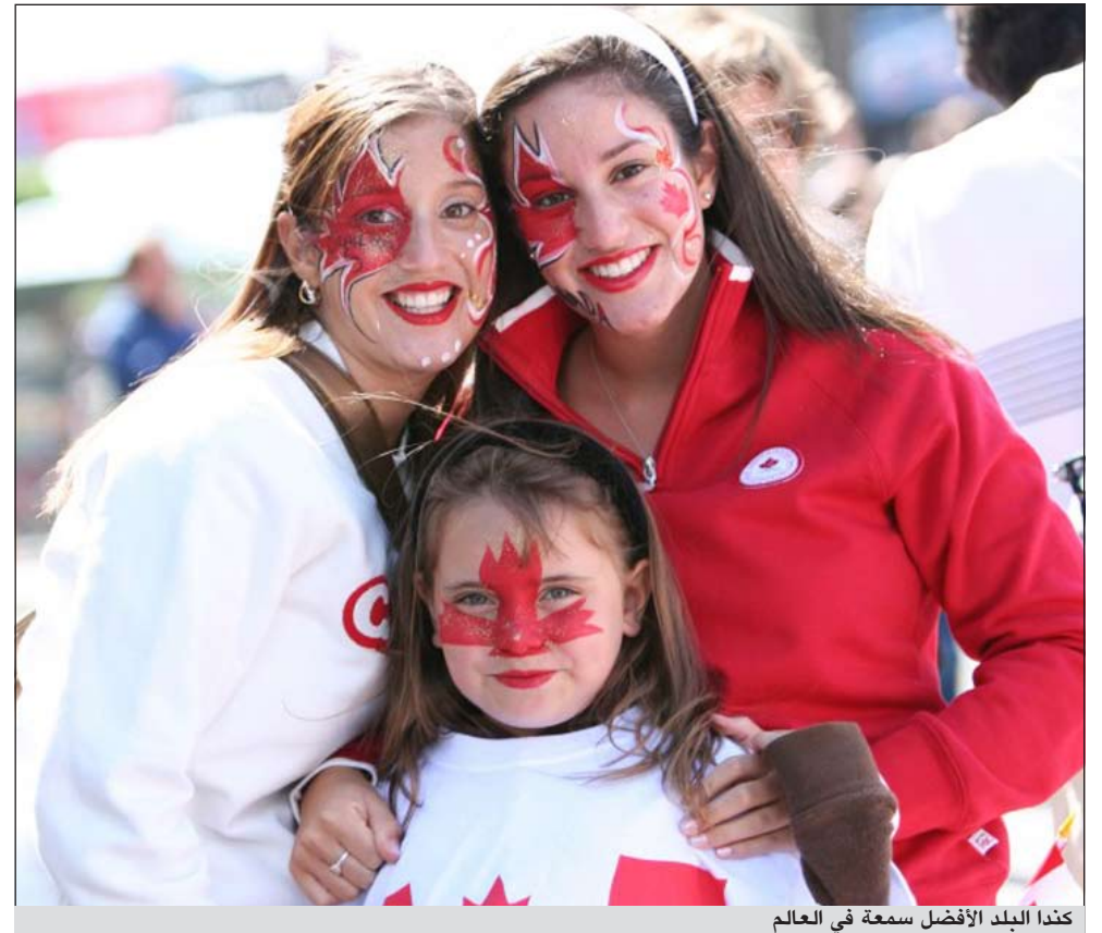
كندا البلد الأفضل سمعة في العالم

مونتريال - أ.ف.ب: كندا هو البلد الذي يتمتع بأفضل سمعة في العالم بحسب استطلاع أميركي للرأي حول صورة خمسين بلداً نشر الثلاثاء. والدراسة التي أجراها معهد «رييوتابيشن اينستيتوت» الذي يتخذ من نيويورك مقراً له عمدت إلى قياس «ثقة الناس وتقديرهم وإعجابهم» تجاه كل بلد بالإضافة إلى نظرهم تجاه نوعية الحياة والأمن والاهتمام بالبيئة في كل واحد من البلدان موضوع الدراسة.