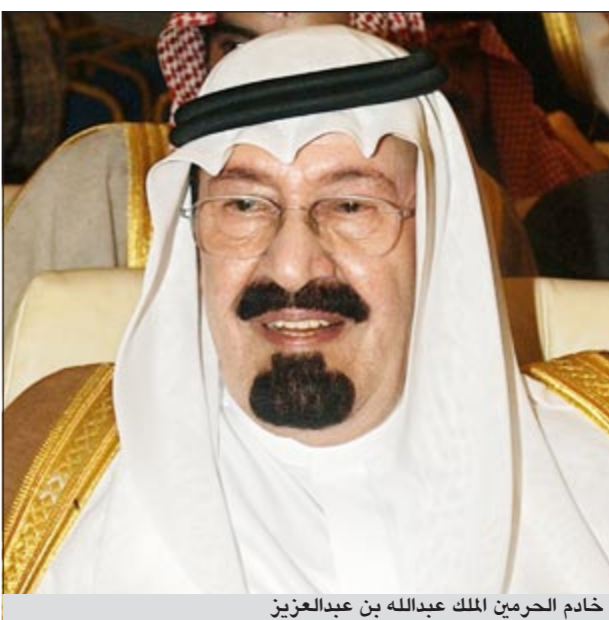
خادم الحرمين الملك عبدالله بن عبدالعزيز

وأضاف أن التوسعة التاريخية الجديدة التي أطلقتموها وجرى بإقرارها توقيعكم الكريم ووضعت حجرها الأساس قبل أيام قليلة بتكلفة تتجاوز مائة ألف مليون ريال تدل على ذلك، أما الأوقاف