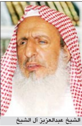
الشيخ عبدالعزيز آل الشيخ

وأضاف قائلاً: ينبغي لجميع المطلوبين أمناً أن يعودوا إلى رشدهم، وأن يحموا الله على أن هيأت لهم الدولة مثل هذه الفرص بالعودة إلى طريق الحق والرشاد، لكي يتداركوا أخطاهم ويصححوا أوضاعهم ويعودوا إلى رشدهم والصواب، واغتنام ما تبقى من الشهر الكريم المبارك ليكفوا بين أهلهم وديهم. وعلى صعيد العائدين من باكستان، أفادت المصادر بأنهما خضعنا لتحقيق أولي حول ظروف وكيفية مغادرتهما المملكة وتوجههما لمناطق صراع وشهدت وتشهد أعمالاً قتالية والتي يرجح أن تكون أفغانستان، في الوقت الذي مكنت وزارة الداخلية العائدين من الاتصال بذويهما الذين سبق