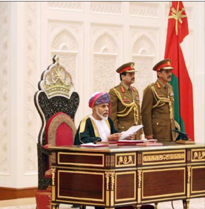
سلطان عمان قابوس بن سعيد خلال افتتاح الفترة الخامسة لمجلس عمان لعام 2011