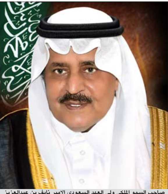
صاحب السمو الملكي ولي العهد السعودي الأمير نايف بن عبدالعزيز

وان يتولاه برعايته ويحفظه بعنايته، كما نسأله سبحانه أن يوفق ويسدد ولي عهده الأمير نايف بن عبدالعزيز في مسؤولياته الجديدة، وأن يحفظه ويتولاه في جميع شؤونه وأمواره، وأن يحفظ بلادنا وبلاد المسلمين وأدام عزها وتوفيقها، أنه قريب مجيب.