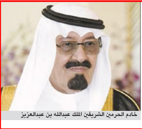
خادم الحرمين الشريفين الملك عبدالله بن عبدالعزيز