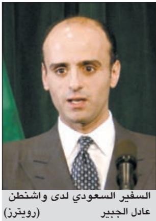
السفير السعودي لدى واشنطن عادل الجبير

الرياض - واس: استمر ارام للفحوصات الطبية المجدولة التي يجريها خادم الحرمين الشريفين الملك عبدالله بن عبدالعزيز خلال الفترة الماضية بعد شعوره بالام في أسفل الظهر، فقد اجريت له الفحوصات اللازمة وتبين وجود تراخ في الرباط المئب حول الفقرة الثالثة، وقد قرر الأطباء ضرورة إجراء عملية لإعادة تثبيت ذلك التراخي وستجرى العملية خلال الايام المقبلة في عاصمة المملكة الرياض.