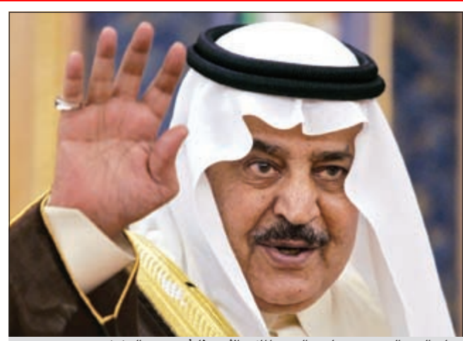
ولي العهد السعودي صاحب السمو الملكي الأمير نايف بن عبدالعزيز

صاحب السمو تمنى له التوفيق في خدمة المملكة الأمير والرئيس الأميركي يهنئان السعودية بتولي الأمير نايف بن عبدالعزيز ولاية العهد