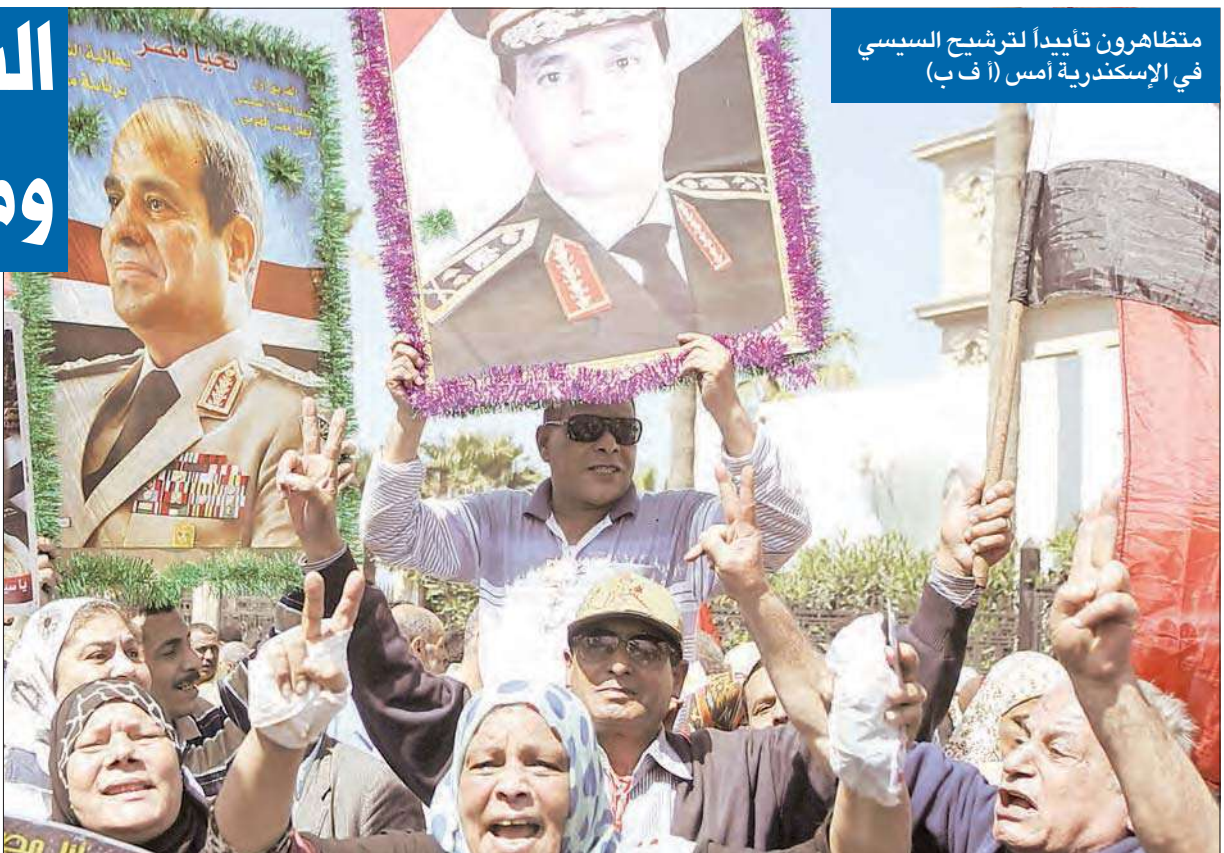
متظاهرون تاييداً لترشيح السيسي في الإسكندرية أمس

بدأ وزير الدفاع السابق عبدالفتاح السيسي مشوار السباق الرئاسي، بتأكيده من مقر حملته الانتخابية الذي زاره مساء أمس الأول، وضع الشعب النهائية لبرنامج يلبى آمال وطموحات الشعب المصري. وفي مقابل طمأنة السيسي المؤيدين له إلى وضع حلول واقعية لمواجهة التدهور الاقتصادي والفقر البطالة، نفذت جماعة الإخوان المسلمين تعهداً بعدم وجود أمن أو استقرار في ظل رئاسته، إذ نظمت تظاهرات حاشدة سمتها جمعة