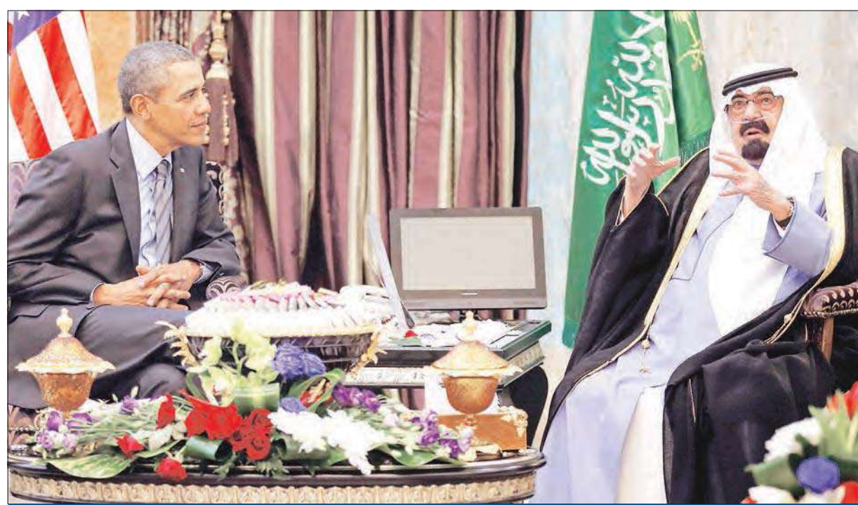
الملك عبدالله مستقبلاً أوباما في روضة الخريم قرب الرياض أمس

● القمة السعودية - الأميركية تناقش الملفات الخلافية وعلى رأسها سورية وإيران ● واشنطن: العلاقات تحسنت خصوصاً على خط دعم المعارضة السورية