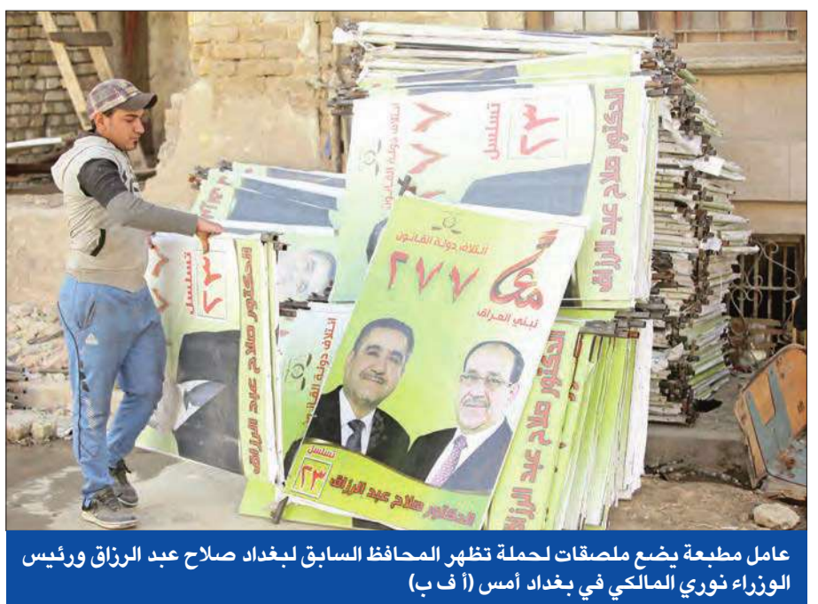
عامل مطبوعة بضع مصلقات حملة تظهر المحافظ السابق لبغداد صلاح عبد الرزاق ورئيس الوزراء نوري المالكي في بغداد أمس

ورأى دهقان أن «زيارة أوباما للمنطقة تأتي بهدف إبداء الدعم للسعودية وتشجيعها على مواصلة تقديم الدعم للإيرانيين