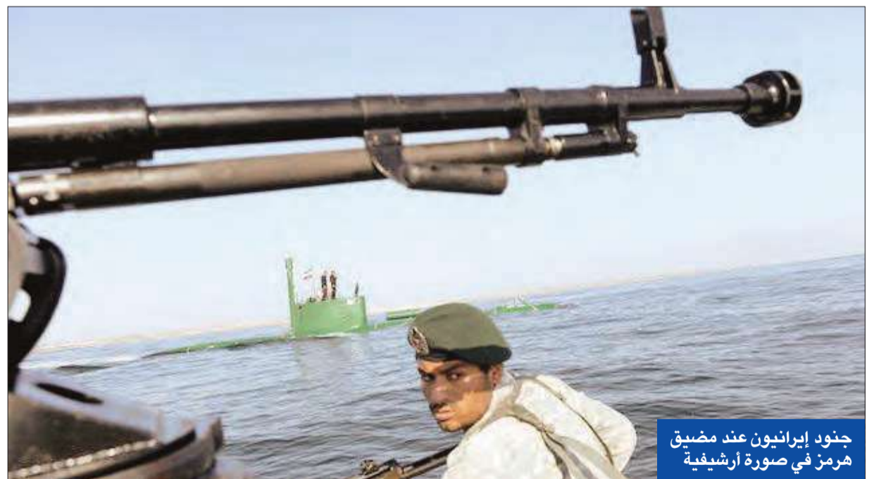
جنود إيرانيون عند مضيق هرمز في صورة أرشفية

إطلاق الرصاص وقع في الجانب العماني من مضيق هرمز بعد نحو 90 دقيقة من اقتراب زورقين سريعيين بهما أفراد طاقم يرتدون الزي العسكري من سفينة تجارية. وقال مركز تنمية الملاحة التجارية التابع لحلف الأطلسي «أقتربت زورقان لونهما أخضر وعلى متنيهما ثلاثة إلى أربعة أشخاص يرتدون ملابس عسكرية مزودين برشاشات إلى مسافة 150 متراً من سفينة تجارية». وأضاف: «بعد برهة ابتعد الزورقان إلى الساحل الإيراني». ولم يطلق الأشخاص الذين كانوا يرتدون ملابس عسكرية واقتربوا من السفينة التجارية أي أعيرة نارية. وقع الحادث على بعد 30 ميلاً بحرياً إلى الغرب من موقع إطلاق النار على ناقلة النفط من زورق سريع آخر. وقال متحدث باسم مركز الشحن التابع للحلف إن تحقيقاً يجري في الواقعتين