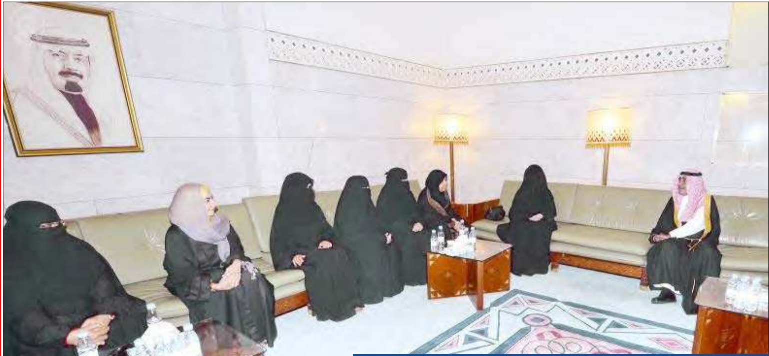
الأمير مقرن مستقبلاً عضوات مجلس الشورى في قصر الحكم في الرياض أمس

بالسجن والتوقيف. كما نص التعديل على إصدار تصريح باسماء وبيانات المسجونين والموقوفين في تلك الجرائم، لتوضيح الحقائق متى ما أثير موضوعهم بشكل لاقت للراي العام أو مخالف للحقيقة، لما في ذلك من تحقيق للمصلحة العامة. (الرياض - واس، د ب أ)