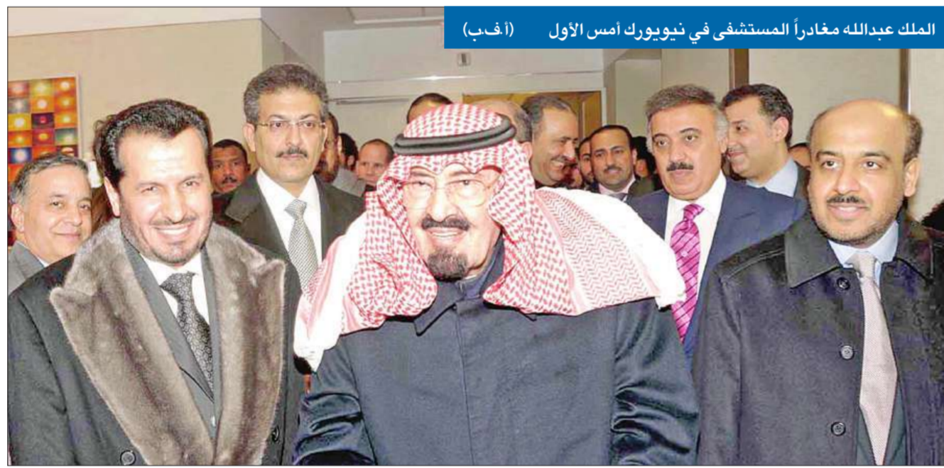
الملك عبدالله مغادراً المستشفى في نيويورك أمس الأول

أعلن الديوان الملكي السعودي أن العاهل السعودي الملك عبدالله بن عبدالعزيز (86 عاماً) غادر مساء أمس الأول، مستشفى برسيبيريان في نيويورك، حيث كان يتلقى العلاج نتيجة إصابته بانزلاق غضروفي، مؤكداً أنه يتمتع بصحة جيدة.