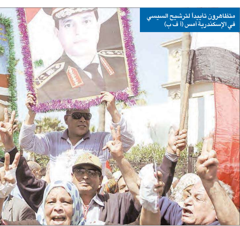
متظاهرون تاييداً لترشيح السيسي في الإسكندرية أمس

القاهرة - الجريدة بدأ وزير الدفاع السابق عبدالفتاح السيسي مشوار السباق الرئاسي، بتأكيده من مقر حملته الانتخابية الذي زاره مساء أمس الأول، وضع الشعب المصرية لبرنامج يلبى آمال وطموحات الشعب المصري. وفي مقابل طمأنة السيسي المؤيدين له إلى وضع حلول واقعية لمواجهة التدهور الاقتصادي والفقر والبطالة، نفذت جماعة الإخوان المسلمين تعهداً بعدم «وجود أمن أو استقرار» في ظل رئاسته، إذ نظمت تظاهرات حاشدة سمتها جمعة «معاً للخلاص»، شهدت أقوى اشتباكات مع قوات الأمن وقتل فيها ثلاثة أشخاص بينهم صحافيّة بجريدة «الدستور»، وأصيب العشرات في حي عين شمس بالقاهرة. وبينما تكررت المواجهات في نحو 8 محافظات، كان أبرزها إضرام النار بأحد السراياقات المؤيدة للسيسي في مدينة بورسعيد، شهدت مدينتا الإسكندرية والفيوم معارك بين أنصار «الإخوان» والأهالي تبادل خلالها الطرفان إطلاق النار وزجاجات المولوتوف. في هذه الأثناء، استجاب أمس العشرات فقط من أنصار السيسي لدعوة حركة تمرد، 02