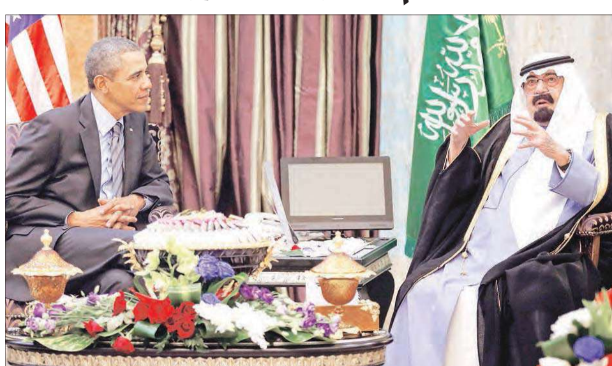
الملك عبدالله مستقبلاً أوباما في روضة الخريم قرب الرياض أمس

● القمة السعودية - الأميركية تناقش الملفات الخلافية وعلى رأسها سورية وإيران ● واشنطن: العلاقات تحسنت خصوصاً على خط دعم المعارضة السورية