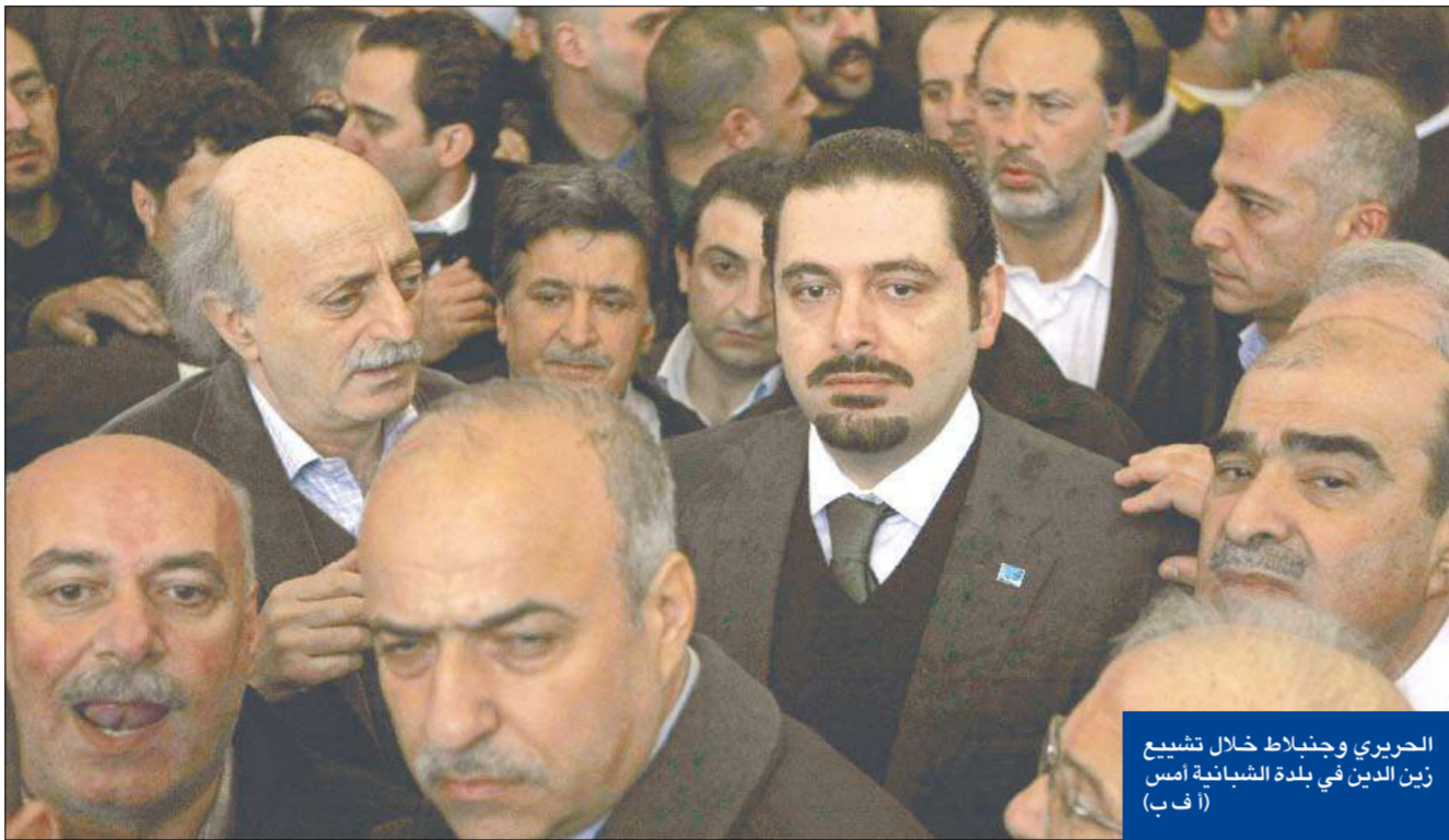
الحريري وجنبلأط خلال تشييع زين الدين في بلدة الشبانية أمس

يجب على من يسير في المواكب أن يلتزم الآداب (عون)