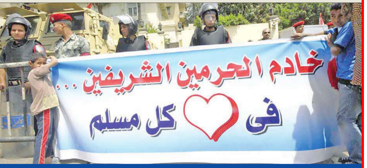
طفل يشارك في حمل لافتة اعتذار لخادم الحرمين الشريفين الملك عبدالله بن عبدالعزيز أمام السفارة السعودية في القاهرة أمس

عنه، وقال رشدي إن "مستشار القنصلية التقى مع الجيزاوي على انفراد لمدة نصف ساعة لبحث تطورات القضية ومجريات التحقيق معه"، موضحاً أن القنصلية تتابع مع هيئة التحقيق والادعاء العام السعودي التحقيقات مع الناشط الحقوقي المصري من جهتها، شككت نقابة المحامين المصرية، في مؤتمر صحافي أمس، في الرواية السعودية المتعلقة بالتهمة الموجهة إلى الجيزاوي، لافتة إلى أن بين البلدين.