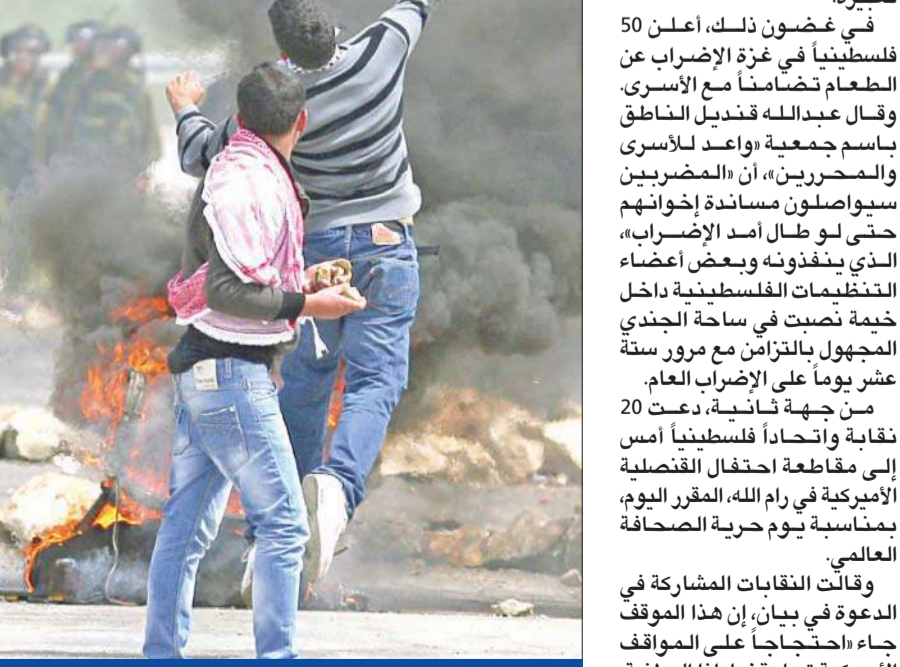
فلسطينيان يلقيان الحجارة على القوات الإسرائيلية خلال اشتباكات خارج سجن عوفور قرب رام الله أمس

20 نقابة فلسطينية تقاطع احتفالاً للقنصلية الأميركية