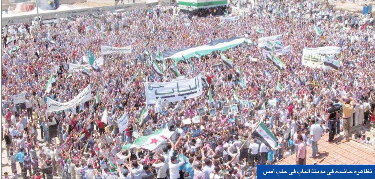
تظاهرة حاشدة في مدينة الباب في حلب أمس

قتل سبعة أشخاص أمس، في هجوم انتحاري استهدف قاعدة لقوة الحلف الأطلسي في ولاية خوست الأفغانية المضطربة. وقال مصدر، طلب عدم الكشف عن اسمه، إن المهاجم صدم بشاحنته المليئة بالمتفجرات الحاجز الأمني الأول خارج القاعدة، مضيفاً أن 13 شخصاً آخرين أصيبوا بجروح في الهجوم. وتبنت حركة طالبان العملية التي هاجم بعدها متعمدون مسلحون (كابول - أ ف ب)