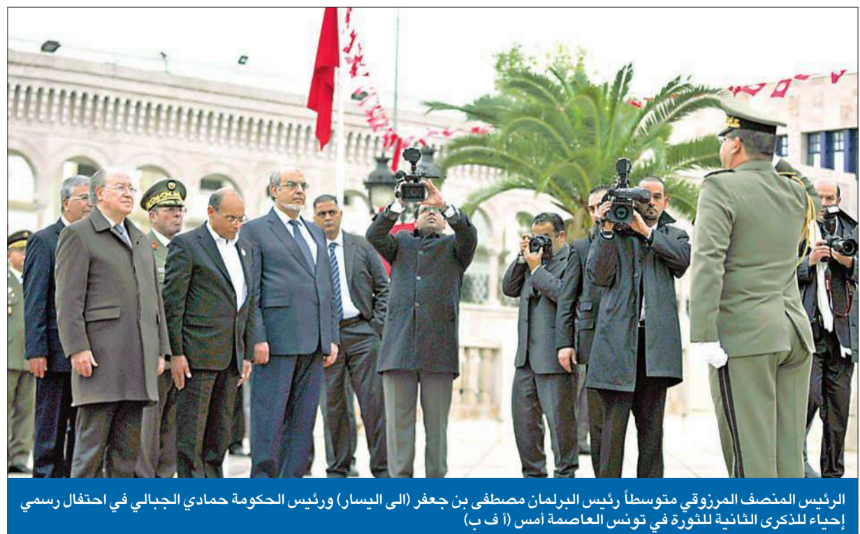
الرئيس المنصف المرزوقي متوسطاً رئيس البرلمان مصطفى بن جعفر (الي اليسار) ورئيس الحكومة حمادي الجبالي في احتفال رسمي إحياء للذكرى الثانية للثورة في تونس العاصمة أمس

المعارضة والموالاة تحييان الذكرى الثانية بمسيرتين منفصلتين