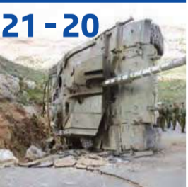
عام على حرب يوليو... ماذا تغير؟ حزب الله بنديقة للإيجار أم طليعة طائفة متحررة؟