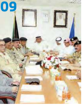
مسؤولون أمنيون كويتيون وعراقيون ينشقون لتنظيم الحدود بين البلدين