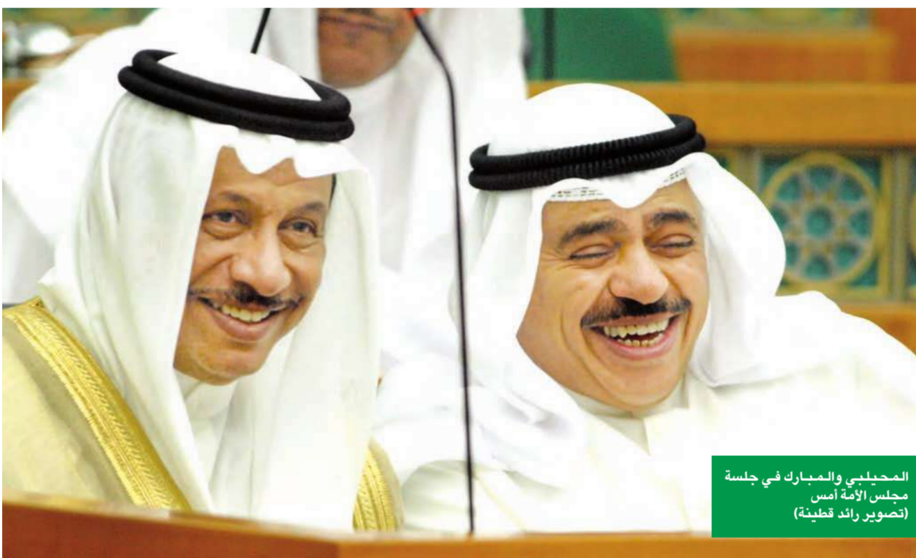
المحلي والمبارك في جلسة مجلس الأمة أمس

النواب والحكومة يتبادلون تهمة عرقلة التنمية حماد يتهم وزير الداخلية بالتنصت... والمجلس يطالبه بالإثبات