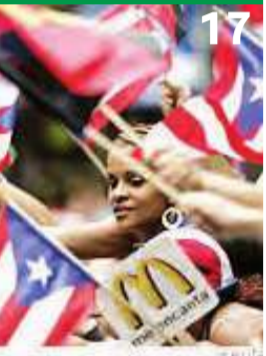
هجرة الأجانب... وعجز المهارات