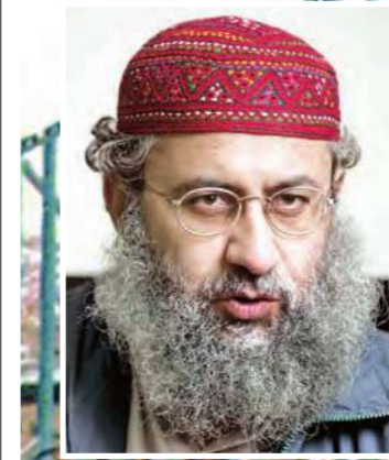
صورة وزعمها الأمن الباكستاني تظهر جانباً مدمرا من سوق الأحد الملاصق للمسجد الأحمر في اسلام اباد. وفي الاطار عبدالرشيد غازي رجل الدين المتشدد الذي قتل أمس