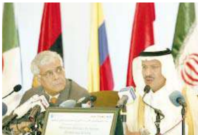
الامير عبدالعزيز بن سلمان والبديري

● الأمين العام للمنظمة: لن ننسخدم النفط كسلاح سياسي ● عبدالعزيز بن سلمان: حماية المنشآت أثبتت كفاءتها