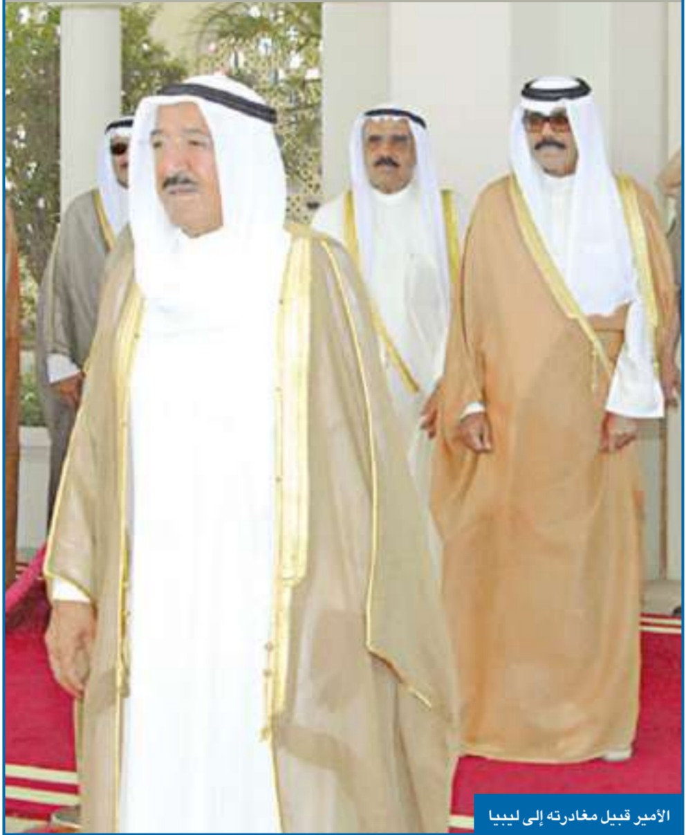
الأمير قبيل مغادرته إلى ليبيا