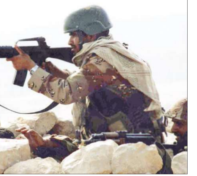
جندي يمضي بصوب سلاحه خلال المواجهات مع المتمردين شمال البلاد أمس

أكد العاهل السعودي الملك عبدالله بن عبدالعزيز أن المملكة ماضية في وقفها في وجه الإرهاب وأربابه، واستئصال شأفة تلك «النفثات الضالة» وتخفيف ونوه العاهل السعودي، خلال ترؤسه مساء أمس الأول مجلس الوزراء السعودي في جلسته الاعتيادية، بعمل رجال الأمن دائماً بعين يقظة ومتابعة مستمرة لإفشال المخططات والأعمال الإرهابية». وأعرب مجلس الوزراء عن تقديره للجهود الكبيرة والمستمرة لرجال الأمن البواسل في وزارة