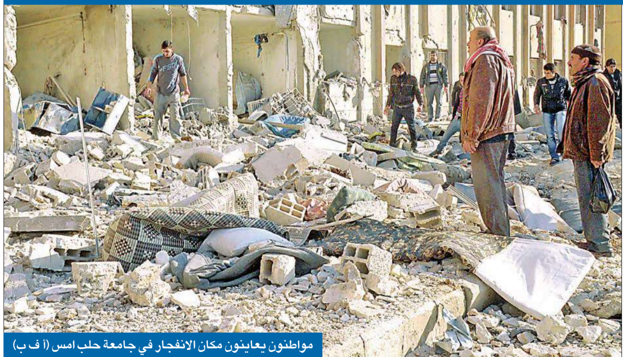
مواطنون يعاينون مكان الانفجار في جامعة حلب أمس

مقتل 80 في انفجار بجامعة حلب... وموسكو ترفض التوجه إلى «الجنائية»