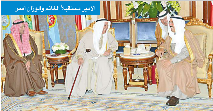
الأمير مستقبلاً الغانم والوزان أمس

سموه تسلم أوراق اعتماد سفيري فلسطين وكوريا وعزى مرسي في ضحايا حادثة القطار