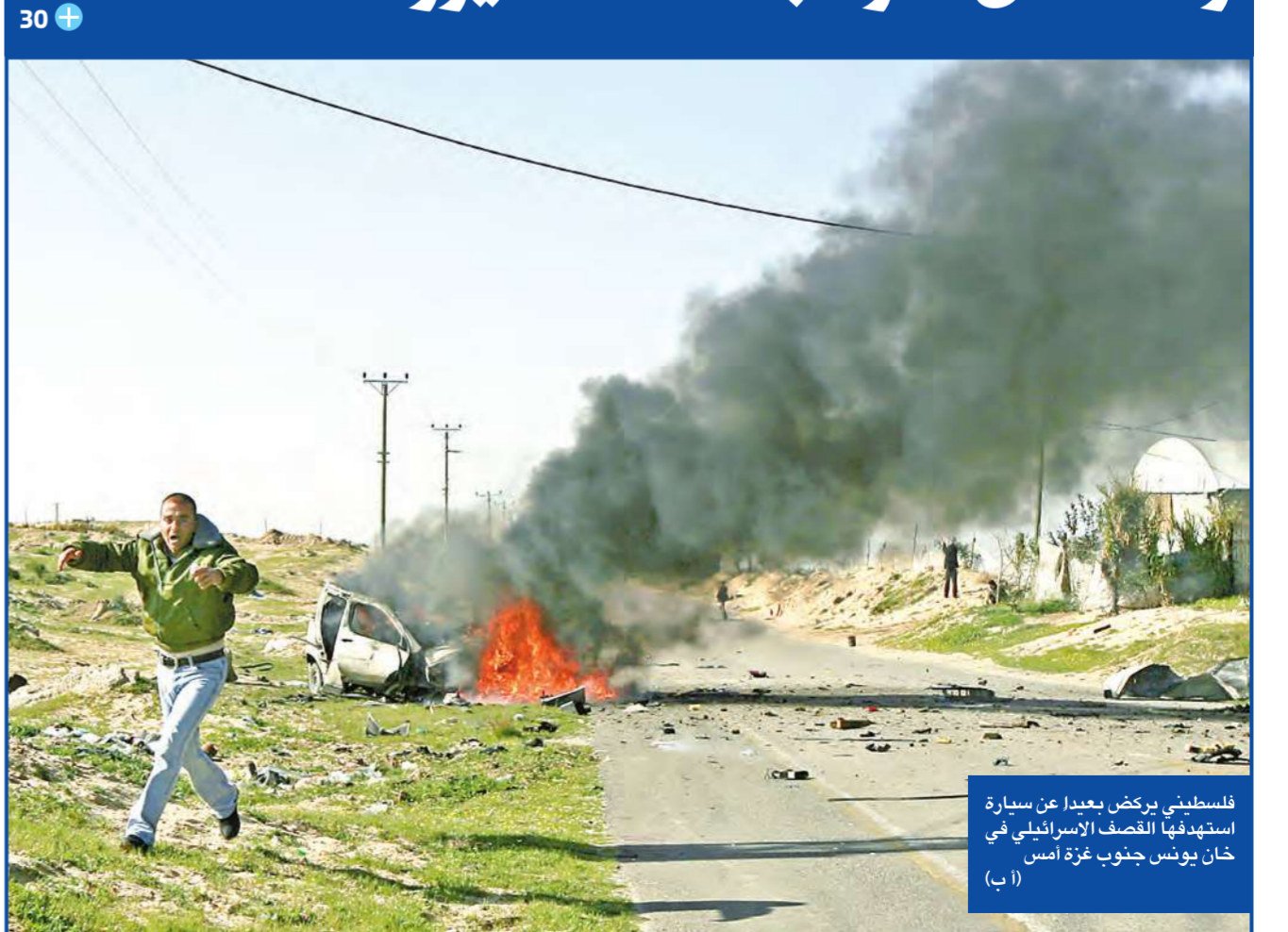
فلسطيني يركض بعيداً عن سيارة استهدفتها القصف الإسرائيلي في خان يونس جنوب غزة أمس