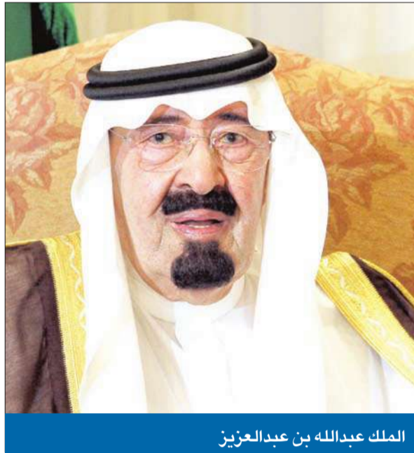
الملك عبدالله بن عبدالعزيز

«ليعلم كل من تدخل في شأن المصريين بأنه يوقد الفتنة ويؤيد إرهاباً يدعي محاربتة» ● «جمعة الإخوان» تنشر الفوضى... وقتلى وجرحى في مسيرات القاهرة والمحافظات