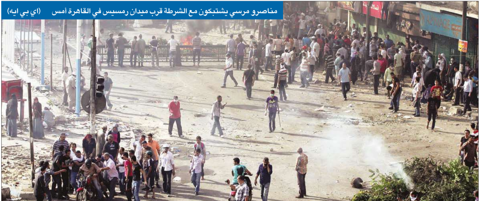
مناصرو مرسى يشتبكون مع الشرطة قرب ميدان رمسيس في القاهرة أمس

يرزعزع دولة لها في تاريخ الأمة الإسلامية والعربية مكان الصدارة مع أشقائها من الشرفاء، ولا يقفوا صامتين، غير أبهين بما يحدث، فالسكت عن الحق شيطان أخرس.