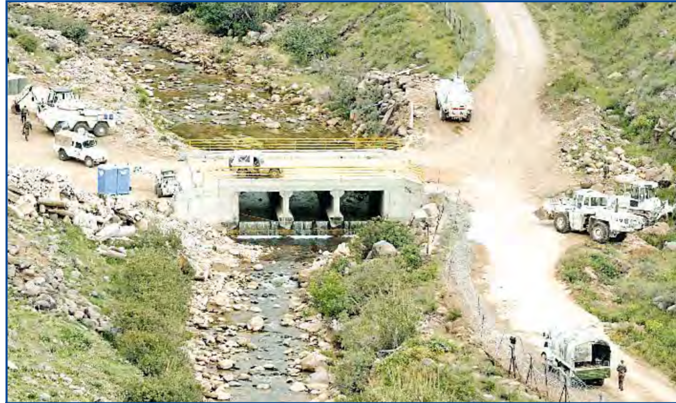
نشرت القوة الدولية المعززة في جنوب لبنان «يونيفيل»، وكذلك الجيش اللبناني، العديد من النقاط العسكرية في منطقة القطاع الشرقي من الجنوب، لمراقبة الأوضاع في منطقة الجليل الاعلى، في وقت تراجع الحركة العسكرية الاسرائيلية على الجانب الآخر من الحدود. وفي الصورة عناصر واليات تابعة لـ «يونيفيل» في الجزء اللبناني من قرية العجر امس.