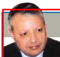
صالح القلاب كاتب وسياسي أردني