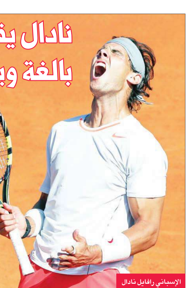
الإسباني رافايل نادال