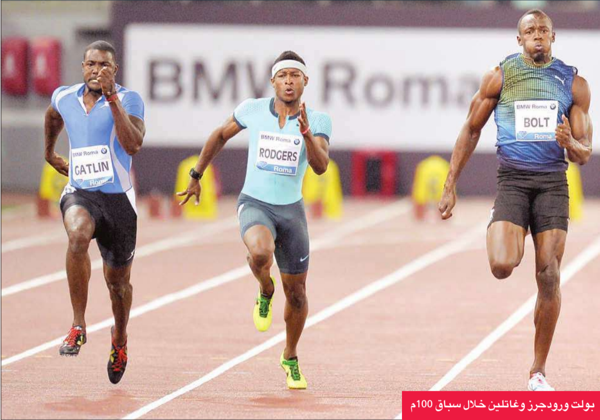
بولت وروجرز وغاتلين خلال سباق 100م

الكثير من العمل والمزيد من الوقت، لكن في كل الحالات نزلت تحت حاجز 10 ثوانٍ.