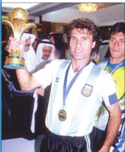
أوسكار روجري قائد المنتخب الأرجنتيني الفائز بأول بطولة لكأس القارات

أقيمت الدورة الثالثة من 12 الى 21 ديسمبر 1997 بمشاركة 8 منتخبات لأول مرة وزعت على مجموعتين ضمت الاولى البرازيل بطله العالم، والسعودية بطله آسيا والدولة المضيفة، والمكسيك بطله الكونكاكاف، واستراليا بطله أوقيانيا، والثانية الأوروغواي بطله أمريكا الجنوبية، وتشيكيا وصيفة بطله أوروبا بعد اعتذار ألمانيا، والإمارات العربية المتحدة وصيفة بطله آسيا (السعودية صاحبة الضيافة)، وجنوب أفريقيا بطله أفريقيا.