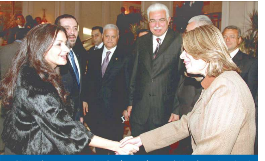
رئيس الوزراء المصري أحمد نظيف وزوجته (إلى اليمين) يستقبلان الحريري وزوجته لارا في مطار القاهرة أمس الأول

حسبت محاكم دبي أخيراً النزاع القضائي الأشهر في دبي، الذي بدأ قبل نحو 22 عاماً حول ملكية مركز تسوق «حمرعين» الواقع في منطقة ديرة في دبي، وفندق «جي دبليو ماريوت» الملاصق له، لتتحول ملكيتهما من يد عائلة حمرعين الإماراتية إلى عائلة بورسلي الكويتية.