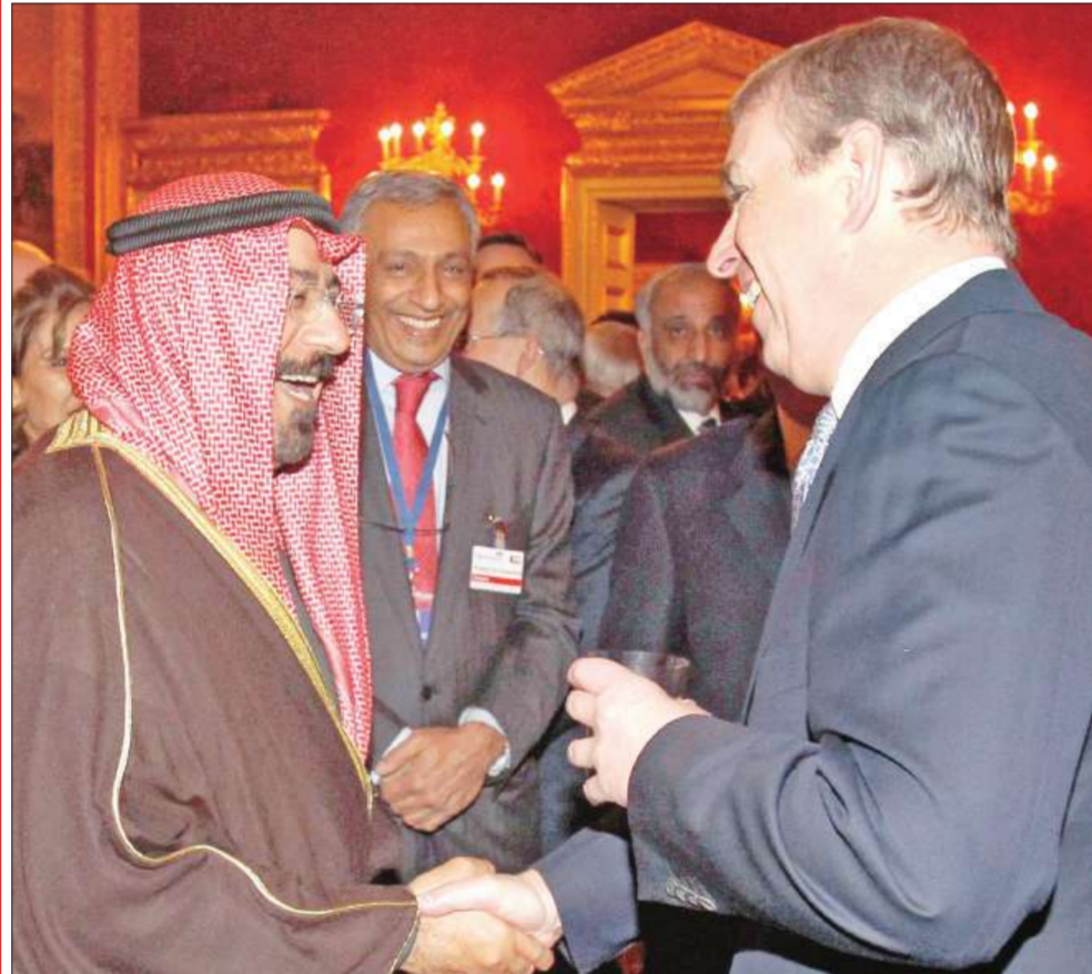
محمد الصباح مصافحاً نجل ملكة بريطانيا الأمير أندرو في لندن أمس

محمد الصباح: استقرار أفغانستان مهم لاستقرار الشرق الأوسط