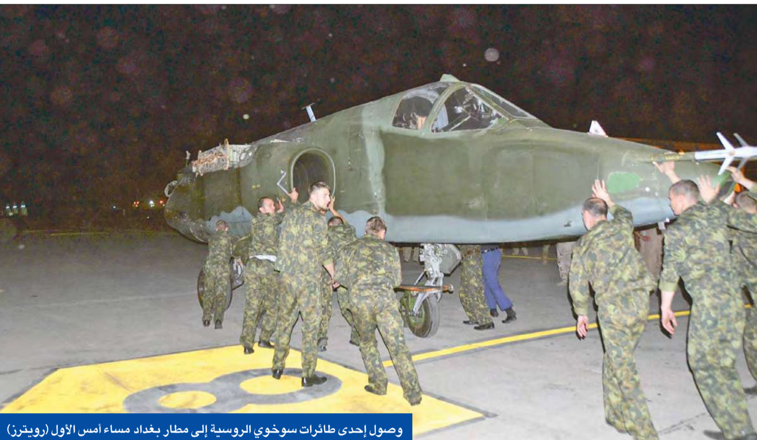
وصول إحدى طائرات سوخوي الروسية إلى مطار بغداد مساء أمس الأول

واعتبر القيادي في كتلة الإحرار، أنه من الضروري «حصول ائتلاف دولة القانون على مناصب مهمة، ومنها نائب رئيس الجمهورية، مع بعض الوزارات المهمة».