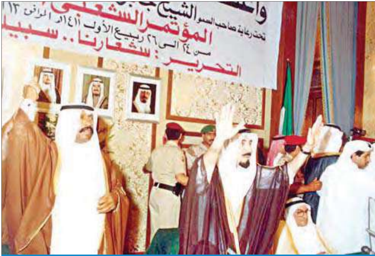
الأمير الراحل الشيخ جابر الأحمد وولي عهده آنذاك الشيخ سعد العبدالله - طيب الله ثراهما - في مؤتمر جدة

في ميثاق الأمم المتحدة وتحقيقه مكاسب كبيرة واستعادته سيادته كاملة غير منقوصة وقوته الاقتصادية في المنطقة، ووطد أيضاً العلاقة الإخوية بين البلدين. وتشير الزيارات المتبادلة والمساعي المتواصلة بين البلدين إلى تحقيق المزيد من التطور والإزدهار لطي صفحة الماضي وبناء مستقبل مشرق وازهر للشعبين الشقيقين.