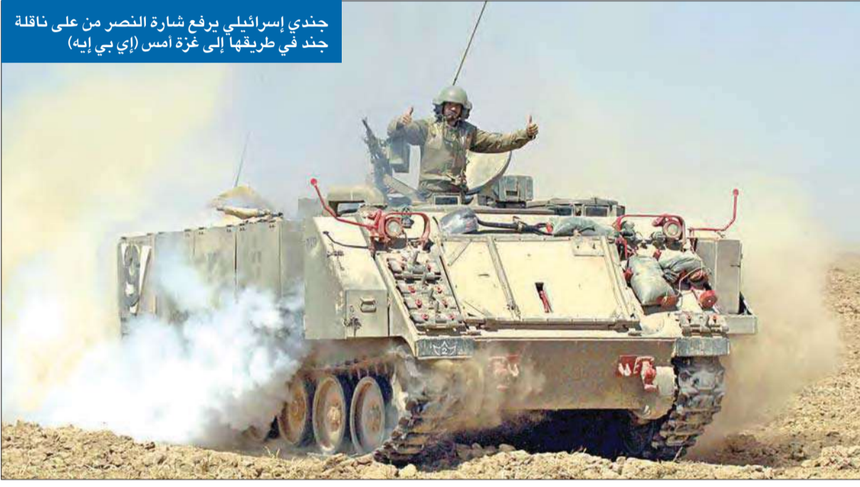
جندي إسرائيلي يرفع شارة النصر من على ناقلة جنود في طريقها إلى غزة أمس

«إرهاب الدول هو الأخطر... والمتخاذلون معه سيكونون أول ضحاياه في الغد» ● أمير قطر يهاتف الملك عبدالله بعيد خطابه ● «حماس» تتهم إسرائيل بخرق الهدنة وتعلن أسر ضابط صف