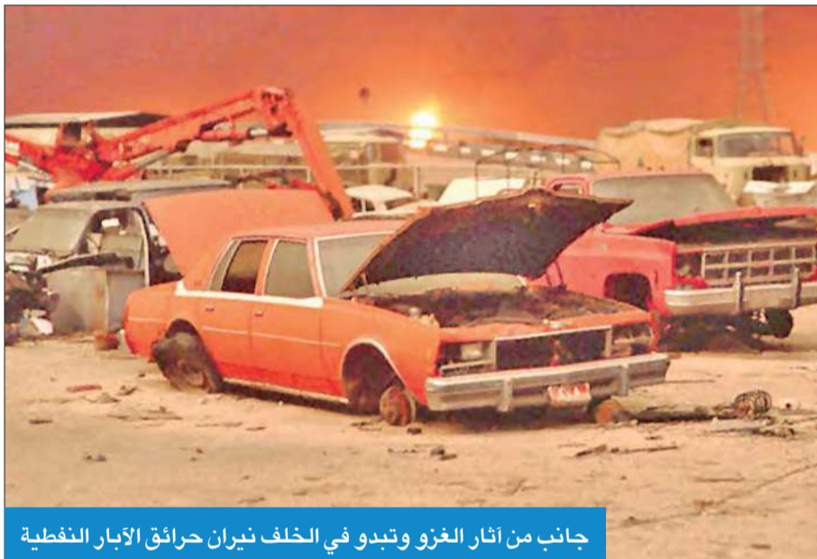
جانب من آثار الغزو وتبدو في الخلف نيران حرائق الأبار النفطية

وعلاوة على ذلك، استهدف الغزو على نحو ممنهج البنية التحتية في البلاد والمؤسسات والمنشآت الحكومية التي أضعفت المحتل في تدميرها فضلاً عن سرقة وثائق الدولة وأرشيفها الوطني، كما تسبب في سباق آخر بإحداث شرخ وانقسام الصف العربي الذي لطالما حملت الشعوب العربية بوحده وتقوية أواصره. ودان المجتمع الدولي تلك الجريمة الكبرى بحق الكويت وشعبها منذ الساعات الأولى للغزو، وتصدى له مجلس الأمن الدولي بقرارات حاسمة بدءاً من القرار رقم 660 الذي دان الغزو وطالب النظام العراقي بسحب قواته فوراً دون شروط