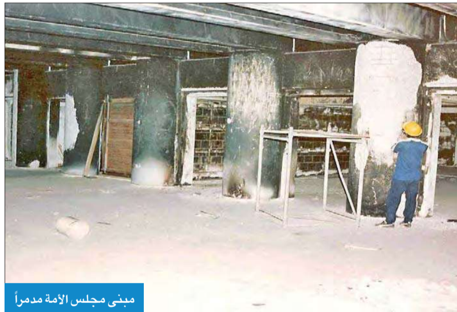
مبنى مجلس الأمة مدمراً

ووسط هذه الأجواء المشتعلة، حث المرجع الأعلى السيد علي السيستاني أمس القيادات السياسية في البرلمان على الإسراع في تشكيل الحكومة الجديدة خلال المهلة الدستورية، لمواجهة الأوضاع الراهنة التي تعيشها البلاد والعبور بالعراق إلى بر الأمان.