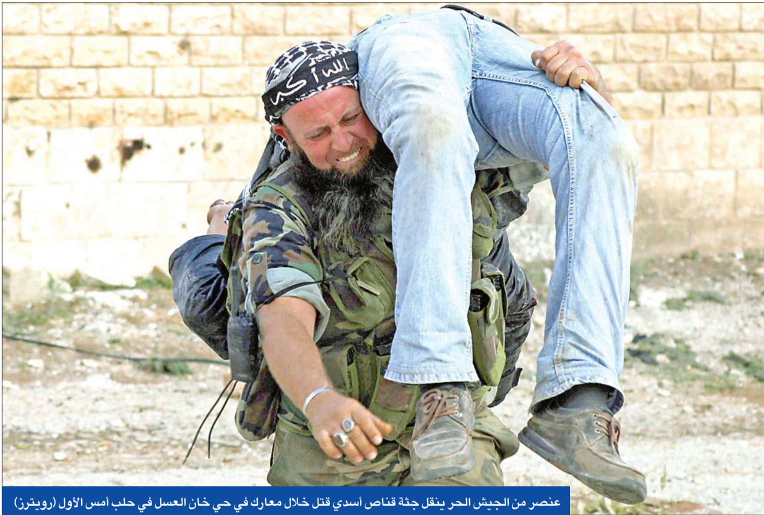
عنصر من الجيش الحر ينقل جثة قناص أسدي قتل خلال معارك في حي خان العسل في حلب أمس الأول

بعد مشاورات وخلافات، تمكنت أطراف المعارضة السورية من التوحد تحت اسم «الائتلاف الوطني لقوى الثورة والمعارضة»، الذي من المفترض أن يبنيق عنه حكومة مؤقتة، جاء ذلك، في حين تواصلت المعارك في جميع أنحاء سورية أمس، خصوصاً في مدينة رأس العين الحدودية مع تركيا، والتي سيطرت عليها المعارضة قبل أيام.