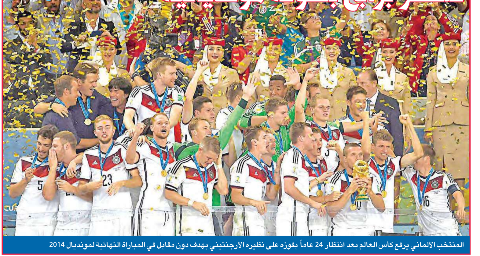
المنتخب الألماني يرفع كأس العالم بعد انتظار 24 عاماً بفوزه على نظيره الأرجنتيني بهدف دون مقابل في المباراة النهائية لمونديال 2014