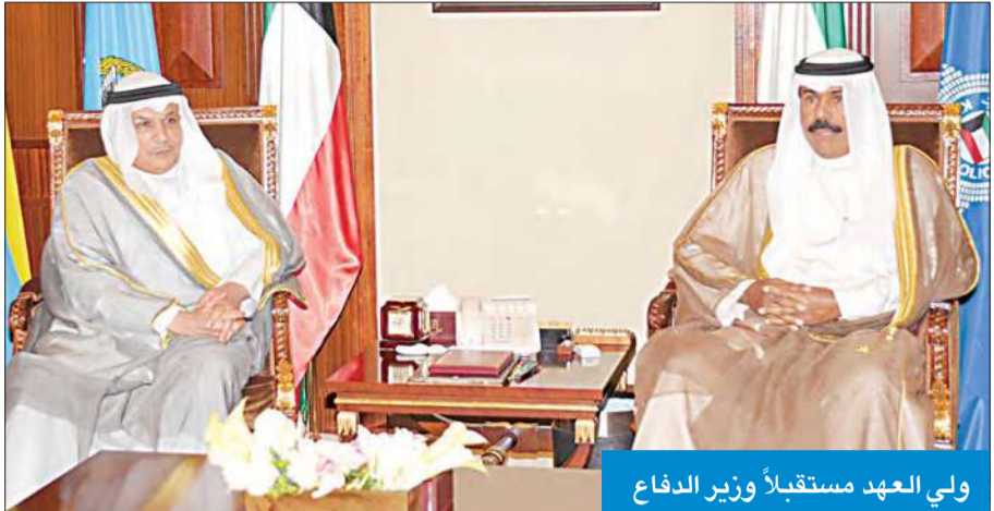
ولي العهد مستقبلاً وزير الدفاع

استقبل سمو ولي العهد الشيخ نواف الأحمد بقصر بيان صباح أمس، رئيس مجلس الأمة مرزوق الغانم، ثم استقبل سموه نائب رئيس مجلس الوزراء وزير الدفاع الشيخ خالد الجراح. واستقبل أيضاً الدكتور محمد البصري، ورئيس تحرير جريدة "السبق" محمد البرجس.