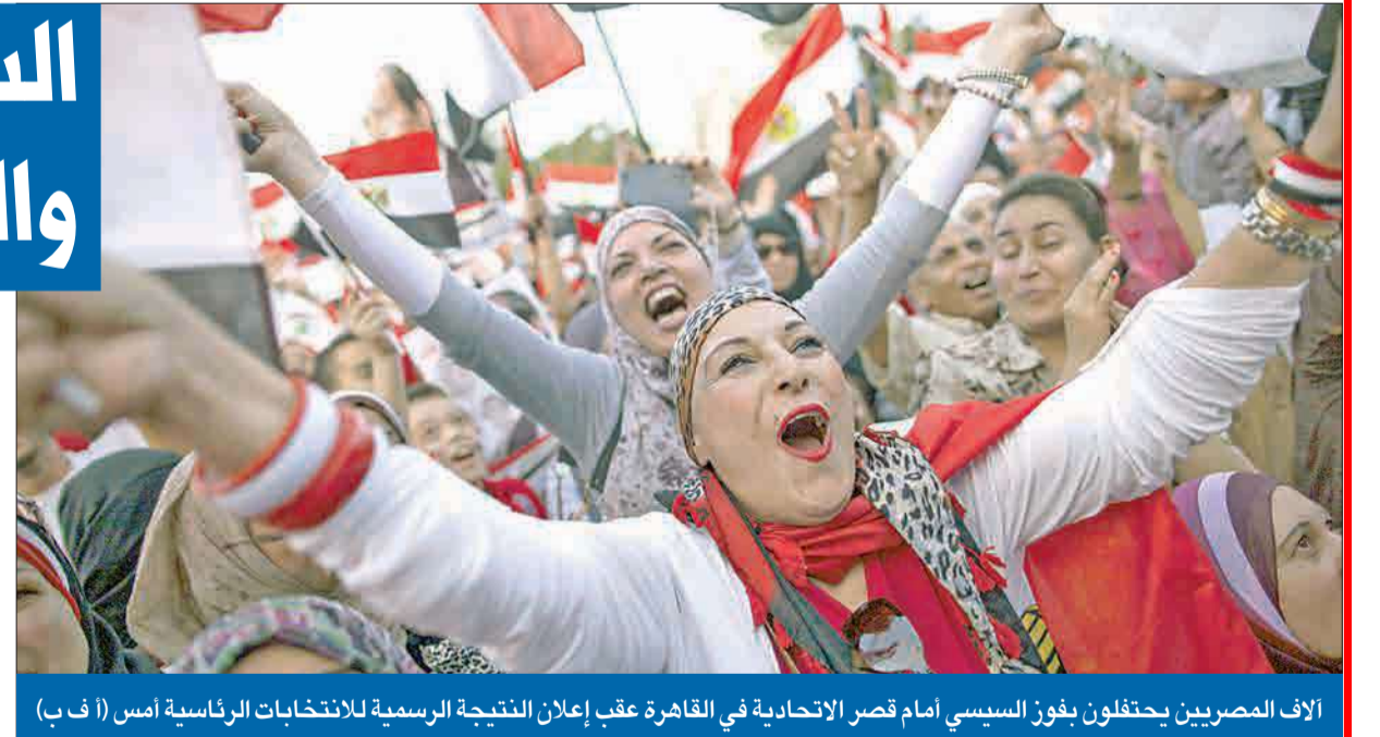
الآلاف المصريين يحتفلون بفوز السيسي أمام قصر الاتحادية في القاهرة عقب إعلان النتيجة الرسمية للانتخابات الرئاسية أمس

دخلت مصر أمس مرحلة جديدة مع الإعلان الرسمي بفوز قائد الجيش السابق المشير عبدالفتاح السيسي برئاسة الجمهورية ليصبح الرئيس الثامن لمصر. وكان العاهل السعودي الملك عبدالله بن