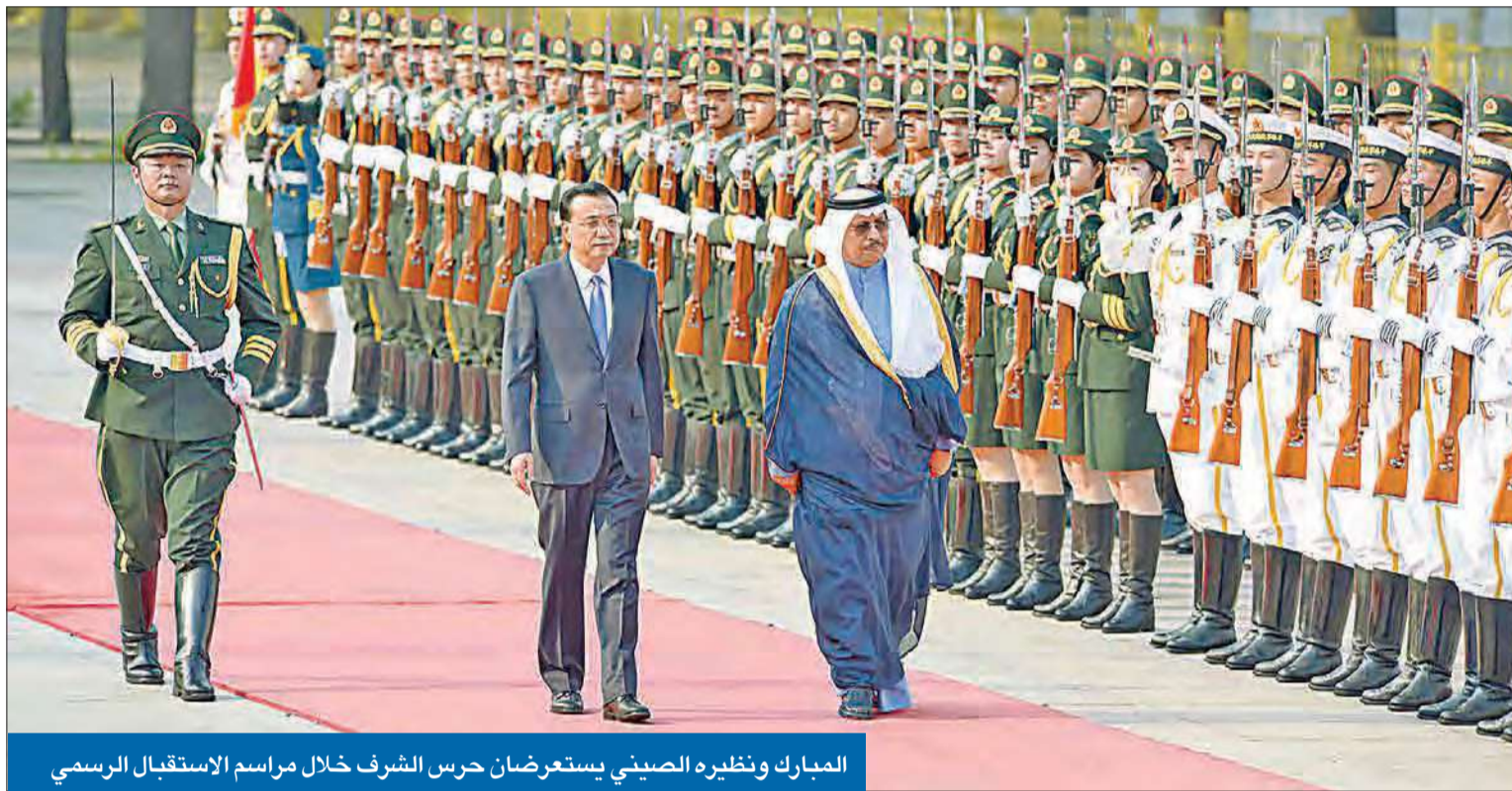
المبارك ونظيره الصيني يستعرضان حرس الشرف خلال مراسم الاستقبال الرسمي

● الكويت وقّعت اتفاقية مع بكين لتطوير التعاون المشترك بشأنها ● مجلس الوزراء يقر تعديلات على مرسوم إنشاء جهازها