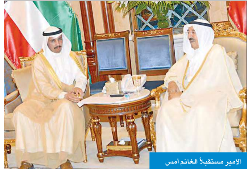
الأمير مستقبلاً الغانم أمس

استقبل سمو أمير البلاد الشيخ صباح الأحمد بقصر بيان صباح أمس، سمو ولي العهد الشيخ نواف الأحمد، كما استقبل سموه رئيس مجلس الأمة مرزوق الغانم. واستقبل سموه رئيس مجلس الوزراء بالإنابة وزير الداخلية وزير الأوقاف والشؤون الإسلامية بالوكالة الشيخ محمد الخالد، واستقبل أيضاً وزير الدولة لشؤون مجلس الوزراء وزير العدل بالوكالة الشيخ محمد العبدالله. في مجال آخر، بعث صاحب السمو ببرقية تهنئة إلى الرئيس المصري عبدالفتاح السيسي أعرب فيها سموه عن خالص تهنئته وأطيب تمنياته بمناسبة انتخابه رئيساً لمصر، مشيراً سموه إلى أن هذه الثقة التي أولاه إياها الشعب المصري إنما تجسد ما يكنه له من تقدير وثقة في قيادة البلد