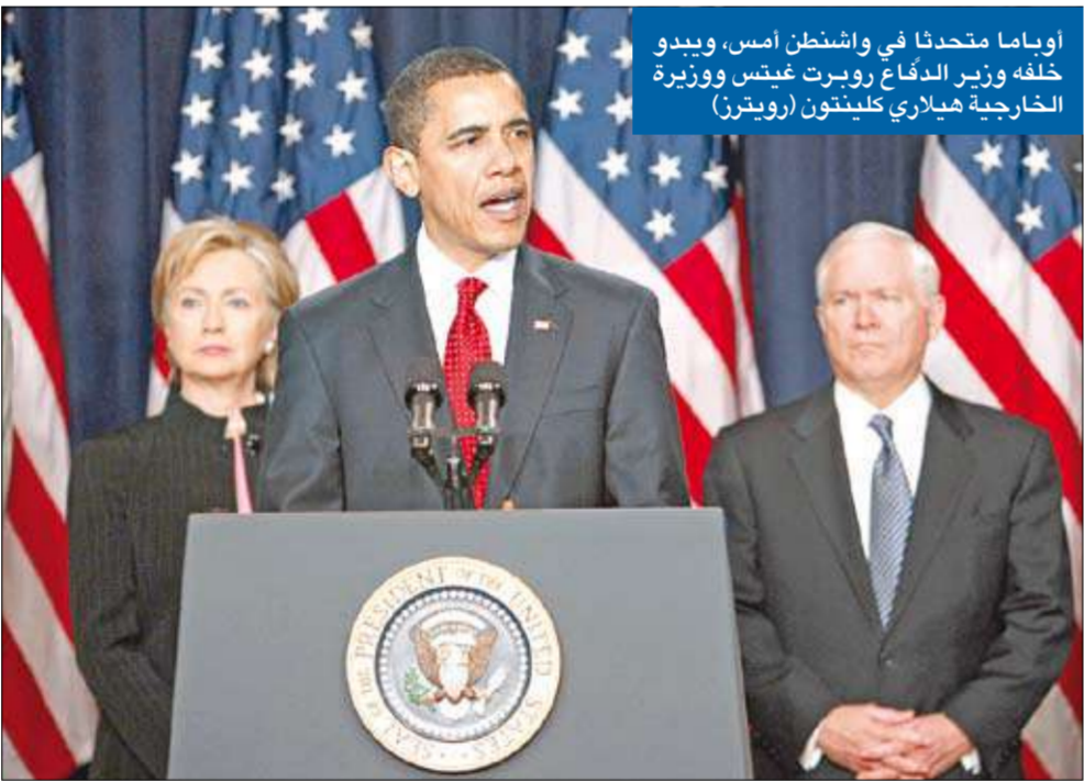
أوباما متحدًا في واشنطن أمس، ويبدو خلفه وزير الدفاع روبرت غنيس ووزيرة الخارجية هيلاري كلينتون

أعاد الرئيس الأميركي باري أوباما توجيه البوصلة العسكرية الأميركية في الحرب على الإرهاب التي انطلقت عقب هجمات الحادي عشر من سبتمبر 2001، في اتجاه كل من باكستان وأفغانستان، إذ توعد أمس، بالقضاء على الإرهابيين في مخابئهم الآمنة بباكستان، محذراً من أن تنظيم القاعدة يخطط لشن هجمات مدمرة، وذلك في إطار كشفه استراتيجيته الجديدة للحرب في تلك المنطقة المضطربة من العالم. ودعا أوباما حلفاء بلاده إلى الانضمام إلى الجهود المدنية الجديدة التي تهدف إلى إحلال الاستقرار في أفغانستان، محذراً في الوقت نفسه من أنه لن يتقاضى عن الفساد الحكومي في كابول والذي يقوّض الثقة بزعمائها. وقال الرئيس الأميركي «الوضع يزداد خطورة، ورغم مرور أكثر من سبع سنوات على الإطاحة بسلطة طالبان، فإن الحرب لاتزال مستمرة ويسيطر المتمردون على أجزاء من أفغانستان وباكستان». وأضاف أن «تنظيم القاعدة وحلفاءه الإرهابيين الذين خططوا لهجمات 11 سبتمبر ودعموها،