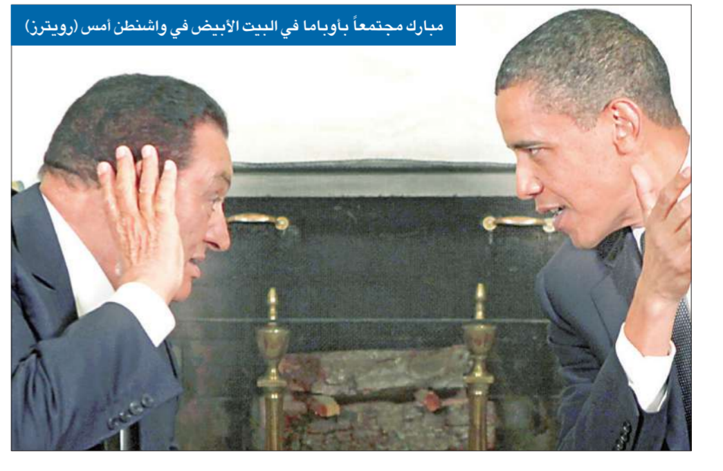
مبارك مجتمعاً بأوباما في البيت الأبيض في واشنطن أمس

في إطار مسعاه إلى استئناف عملية السلام المتوقفة في الشرق الأوسط، أجرى الرئيس الأميركي باراك أوباما في واشنطن أمس محادثات مع الرئيس المصري حسني مبارك، الذي تأمل الإدارة الأميركية أن يساعد في تحريك عجلة السلام، في وقت استبق المحادثات إعلان إسرائيل بالإحجام عن بدء مشاريع إسكان جديدة في مستوطنات الضفة الغربية. والتقى الرئيسان في أول زيارة لمبارك إلى الولايات المتحدة منذ عام 2004، إذ انقطع عن زيارتها بسبب تركيز إدارة الرئيس السابق جورج بوش على النهوض بالديمقراطية في الشرق الأوسط، وانتقادها سجل مصر في مجال حقوق الإنسان. واعتبر مبارك في مؤتمر صحافي مشترك مع أوباما، أعقب المحادثات، أن الوقت حان للانتقال إلى مفاوضات «الحل النهائي» بين إسرائيل