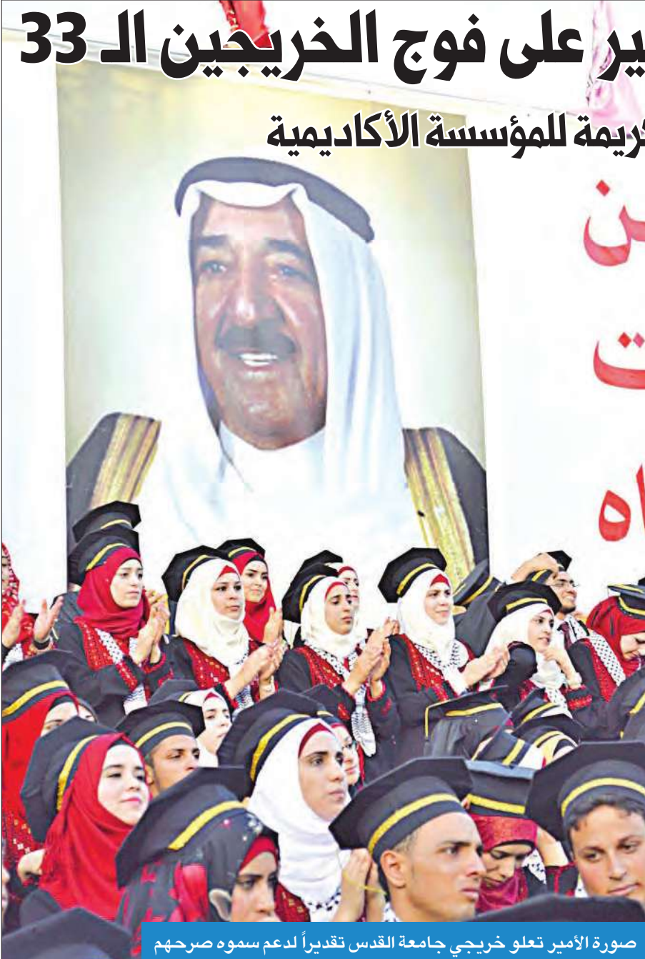
صورة الأمير تعلق خريجي جامعة القدس تقديراً لدعم سموه صرحهم

تكريماً وتقديراً لمبادرة سموه الخيرة ورعايته الكريمة للمؤسسة الأكاديمية