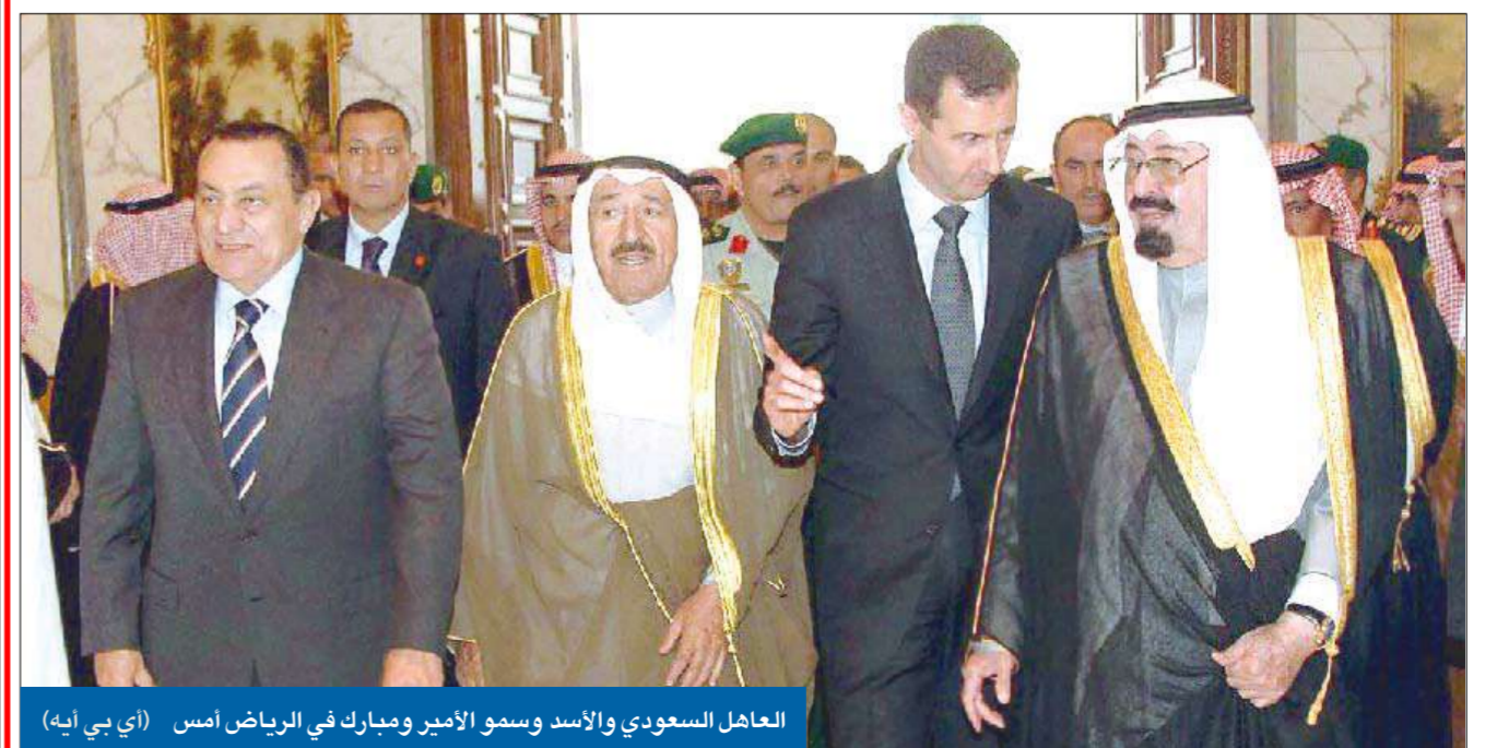
العاهل السعودي والأسد وسمو الأمير ومبارك في الرياض أمس

بعد سلسلة من التحركات العربية التي انطلقت عقب نداء العاهل السعودي الملك عبدالله للمصالحة العربية في قمة الكويت الاقتصادية في يناير الماضي، عقدت في الرياض أمس، قمة عربية رابعة، شارك فيها، إضافة إلى العاهل السعودي، كل من سمو أمير البلاد الشيخ صباح الأحمد، والرئيس المصري حسني مبارك والرئيس السوري بشار الأسد. وأعلن القادة الأربعة في بيان أعقب اجتماعهم، أن