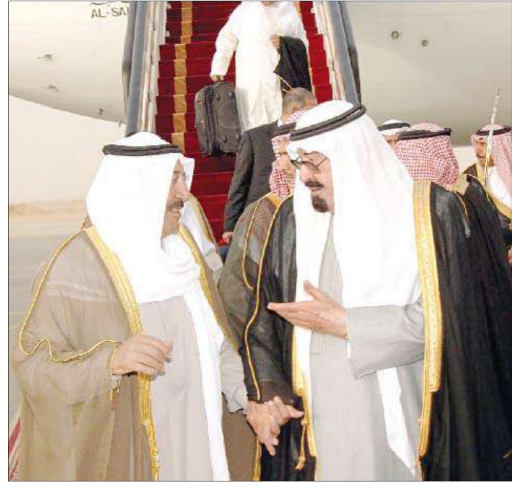
الأمير عند وصوله الرياض وفي استقباله خادم الحرمين الشريفين

وكان في استقبال سموه لدى وصوله مطار قاعة الرياض وذلك الجوية أخوه خادم الحرمين الشريفين الملك عبدالله بن عبدالعزيز آل سعود عاهل المملكة العربية السعودية الشقيقة لحضور القمة المصغرة التي ستعقد في العاصمة الرياض. وكان في وداع سموه على أرض المطار سمو ولي العهد الشيخ نواف الأحمد ورئيس مجلس الأمة جاسم الخرافي ونائب رئيس الحرس الوطني الشيخ مشعل الأحمد وسمو رئيس مجلس الوزراء الشيخ ناصر المحمد ووزير شؤون الديوان الأميري الشيخ ناصر صباح الأحمد وكبار المسؤولين بالبلاد.