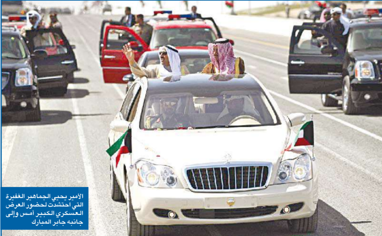
الأمير يحيى الجماهير الغفيرة التي احتشدت لحضور العرض العسكري الكبير أمس وإلى جانبه جابر المبارك

أعرب النائب الأول لرئيس مجلس الوزراء وزير الدفاع الشيخ جابر المبارك عن استيائه «مما تناقلته بعض وسائل الإعلام المحلية عن اجتماع عقد أخيراً وضم القيادة السياسية وعدداً من أبناء الأسرة الحاكمة للتشاور والتباحث في جملة قضايا تهم الوطن العزيز». وأشار المبارك إلى أن ما نشر عن هذا الاجتماع في وسائل الإعلام «ادعاءات مبتغاهما ضرب وحدة وتعاضد الأسرة التي ألفت مثل هذه الاجتماعات على مدى عقود طويلة، إلى أن جاء من لا يرعى خصوصية ما يطرح في المجالس وأمانات الحديث فيها ولا تهمهم الأمانة والموضوعية في النقل». وأكد المبارك أنه استأذن صاحب السمو الأمير في الرد على ادعاءات وأقاويل «من لم يراع طبيعة الاجتماع وحضور رموز الدولة والأسرة ورئاسة سموه لهذا الاجتماع» مضمناً أن «التسريبات هدفت إلى تشويه بعض أقطاب الأسرة وتصويرهم مختلفين ومتشككين حول أساسيات وطنية مثل سيادة الدستور والقانون ومبدأ المشاركة الشعبية والحريات العامة وهم بذلك كمن يدعو الأسرة إلى نبذ تلك الاجتماعات في المستقبل بعد أن أصبحت عرضة للتسريبات الرخيصة» متمنياً «إلا يكون هناك من يدبر إلى إجهاض هذه الاجتماعات التي نحن بأمس الحاجة لها بين فترة وأخرى». وأوضح المبارك قائلاً: «إن أبناء الصباح هم أولاً مواطنون كويتيون يقتسمون مع إخوانهم المواطنين كل شيء ويتبادلون في الحقوق»