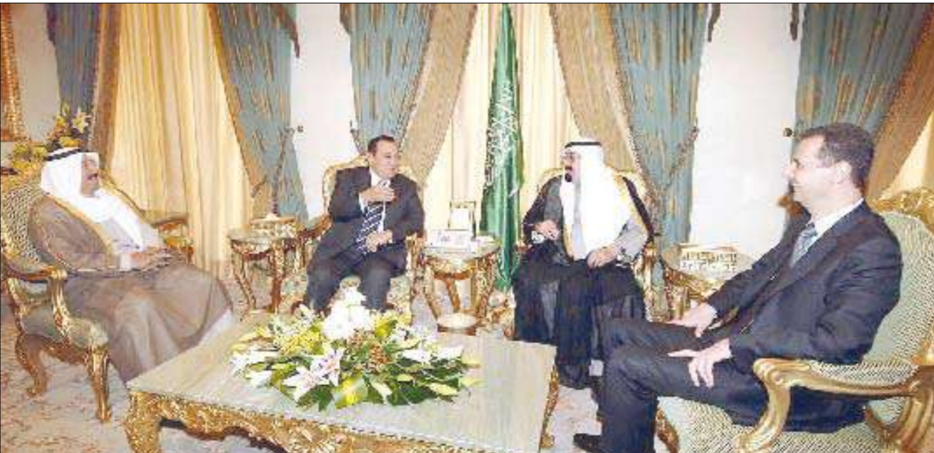
الأسد والعاهل السعودي ومبارك وسمو الأمير في الرياض أمس

وقال ساركوزي: «حلف شمال الأطلسي لا يخوض حرب الحضارات، فهو تحرك لانتقاد المسلمين في البوسنة وكوسوفو، هذه حقيقة تاريخية... والأطلسي يدافع عن الأفغان ضد عودة طالبان والقاعدة إلى السلطة، والحر ضد العراق لـ علاقة لها اطلاقا بالحلف الأطلسي... ويكذب من يدعي أنه لو كانت فرنسا في القيادة العسكرية للأطلسي خلال الحرب على العراق لكانت شاركت فيها، وهذا هراء وكذب معيب».