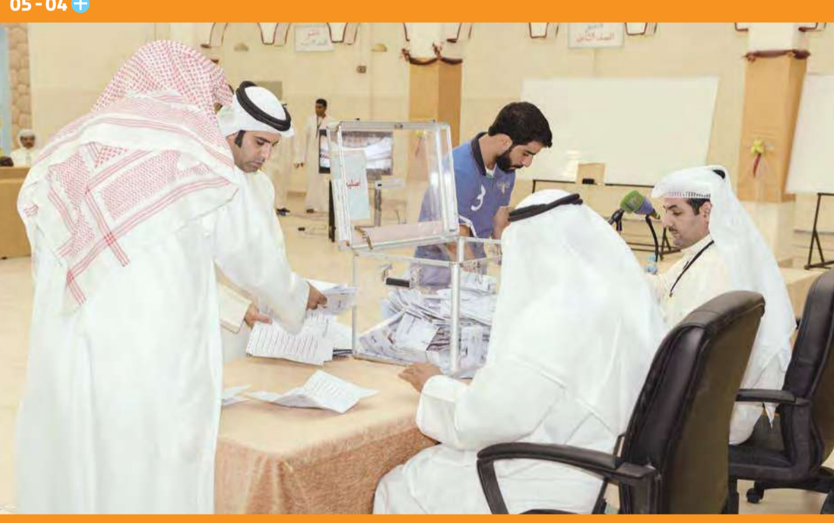
جانب من عملية فرز الأصوات للانتخابات التكميلية لمجلس الأمة للفصل التشريعي الـ 14 أمس