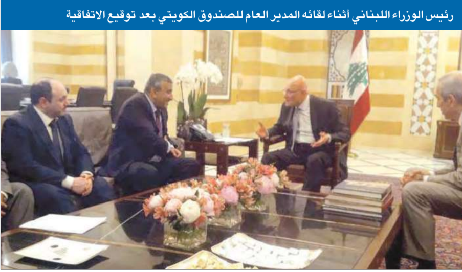
رئيس الوزراء اللبناني أثناء لقائه المدير العام للصندوق الكويتي بعد توقيع الاتفاقية

فضلًا عن الخدمات الإستشارية اللازمة لتنفيذ المشروع. وقدم الصندوق الكويتي للتنمية الاقتصادية العربية للبنان حتى الآن 21 قرصاً بقيمة تصل إلى أكثر من 698 مليون دولار، إضافة إلى عدد من المنح بقيمة وصلت إلى نحو 420 مليون دولار تضمنت تنفيذ مشاريع في القطاع الصحي والتربوي والزراعي والنقل والمواصلات.