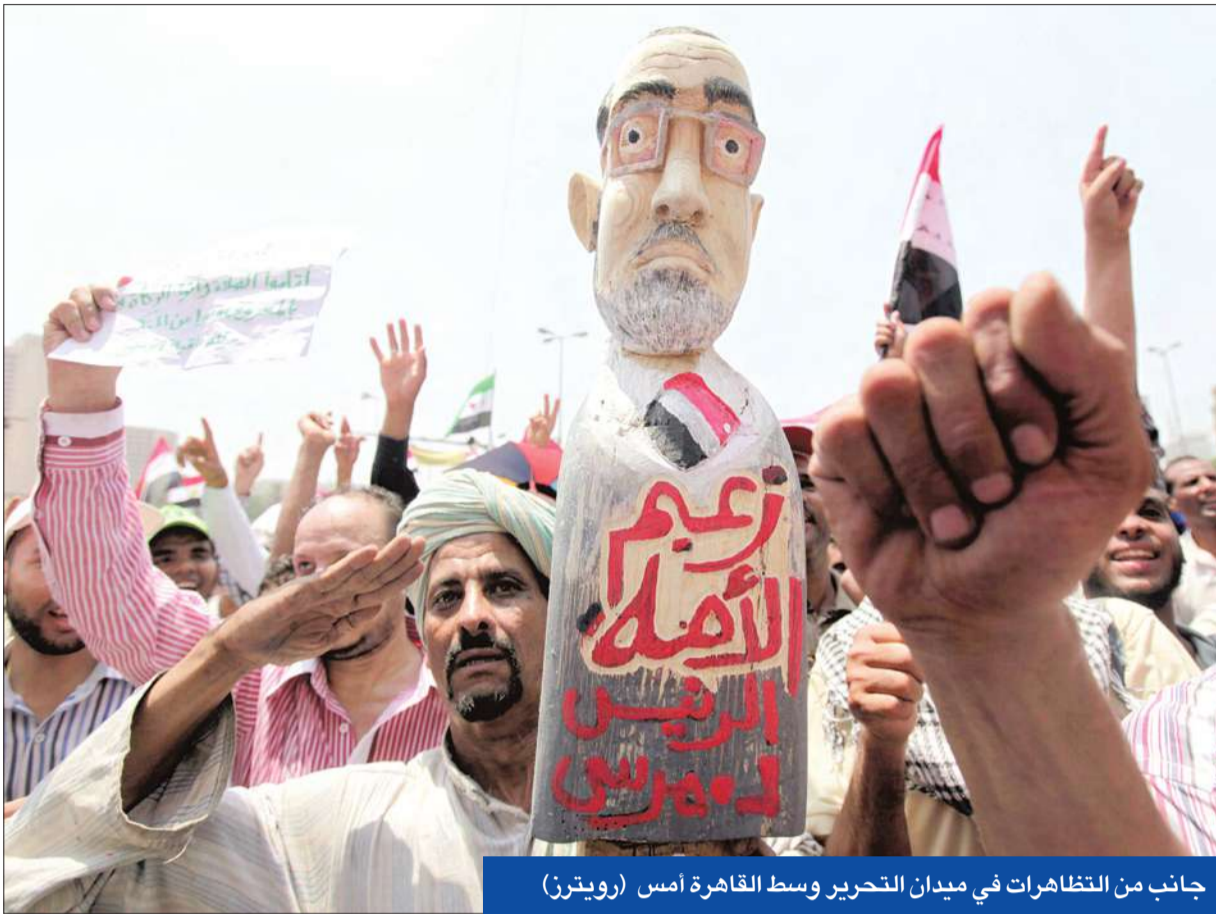
جانب من التظاهرات في ميدان التحرير وسط القاهرة أمس

في المقابل، احتشد أنصار المرشح الرئاسي الخاسر