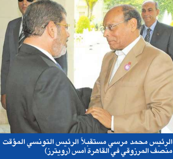
الرئيس محمد مرسى مستقبلاً الرئيس التونسي المؤقت منصف المرزوقي في القاهرة أمس

الأميركية مهمة جداً ببقاء مرسى وعدد آخر من رموز المجتمع المدني.