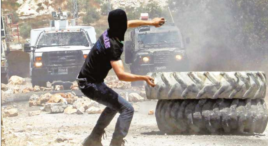
شاب فلسطيني يرشق اليات للجيش الإسرائيلي بالحجارة خلال احتجاجات ضد مستوطنة كادوميم قرب نابلس أمس. وقد ادت المواجهات بين الجانبين إلى سقوط 23 جريحاً فلسطينياً.

وقال السفير الفلسطيني لدى المملكة جمال الشويكي إن عباس بحث مع العاهل السعودي الملك عبدالله بن عبدالعزيز الذي استقبله في جدة (غرب) "الأزمة المالية التي تواجهها السلطة الفلسطينية التي لم تعد قادرة على دفع رواتب موظفي القطاع العام مع اقتراب شهر رمضان" اعتباراً من 20 يوليو، مضيفاً أن "الرئيس عباس طلب مساعدة المملكة السعودية وشكرها على دعمها المستمر للفلسطينيين". وأشار الشويكي إلى أن اللقاء تناول أيضاً عملية السلام