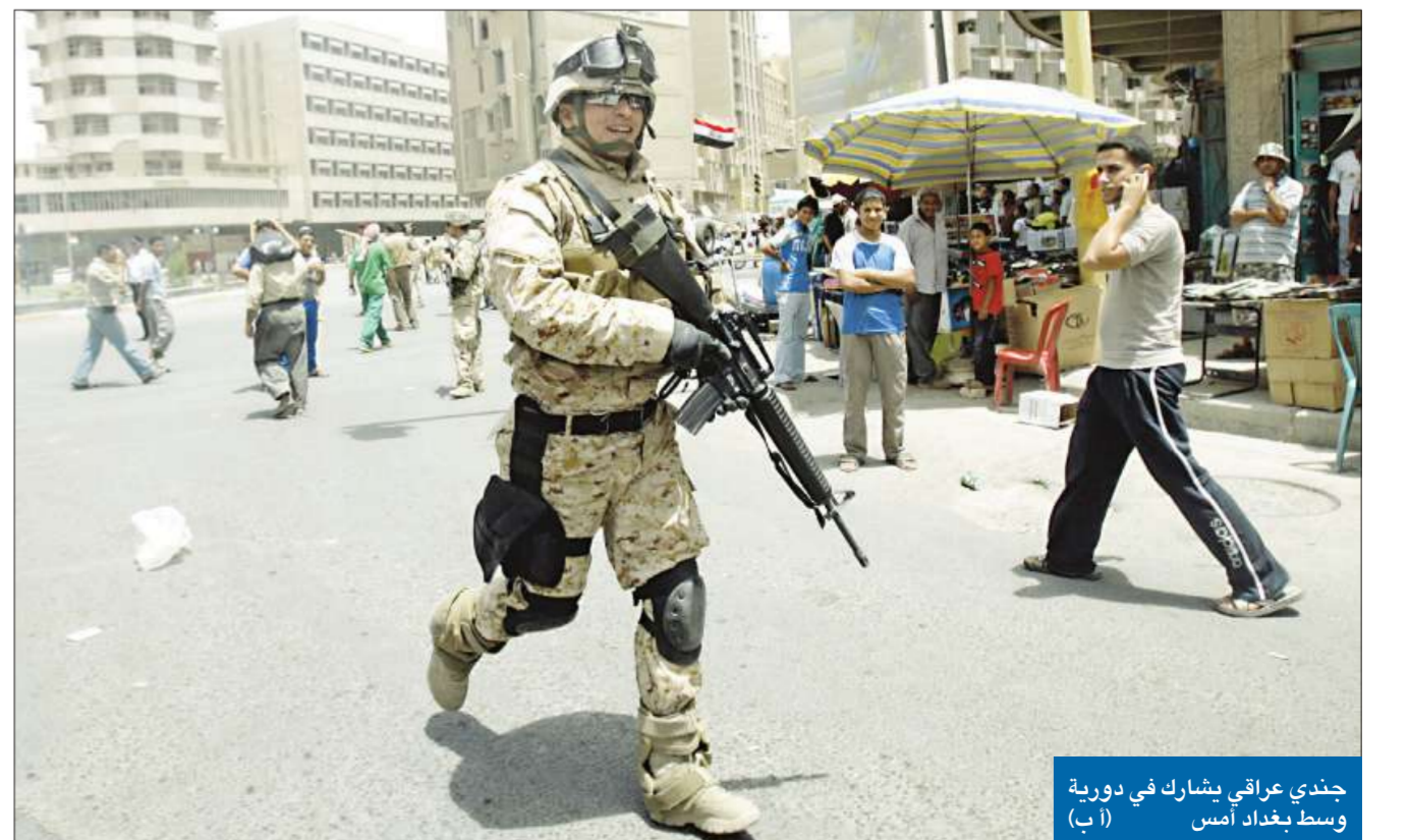
جندي عراقي يشارك في دورية وسط بغداد أمس

دخل العراق اليوم، مع انسحاب القوات الأميركية من المدن، عهداً جديداً، وضعت حكومة بغداد في إطار استعادة السيادة الحقيقية، بعد ست سنوات من سقوط النظام السابق على يد قوات «التحالف» التي تقودها الولايات المتحدة. وانتمت القوات الأميركية أمس، انسحابها من المدن العراقية، لتتسلم