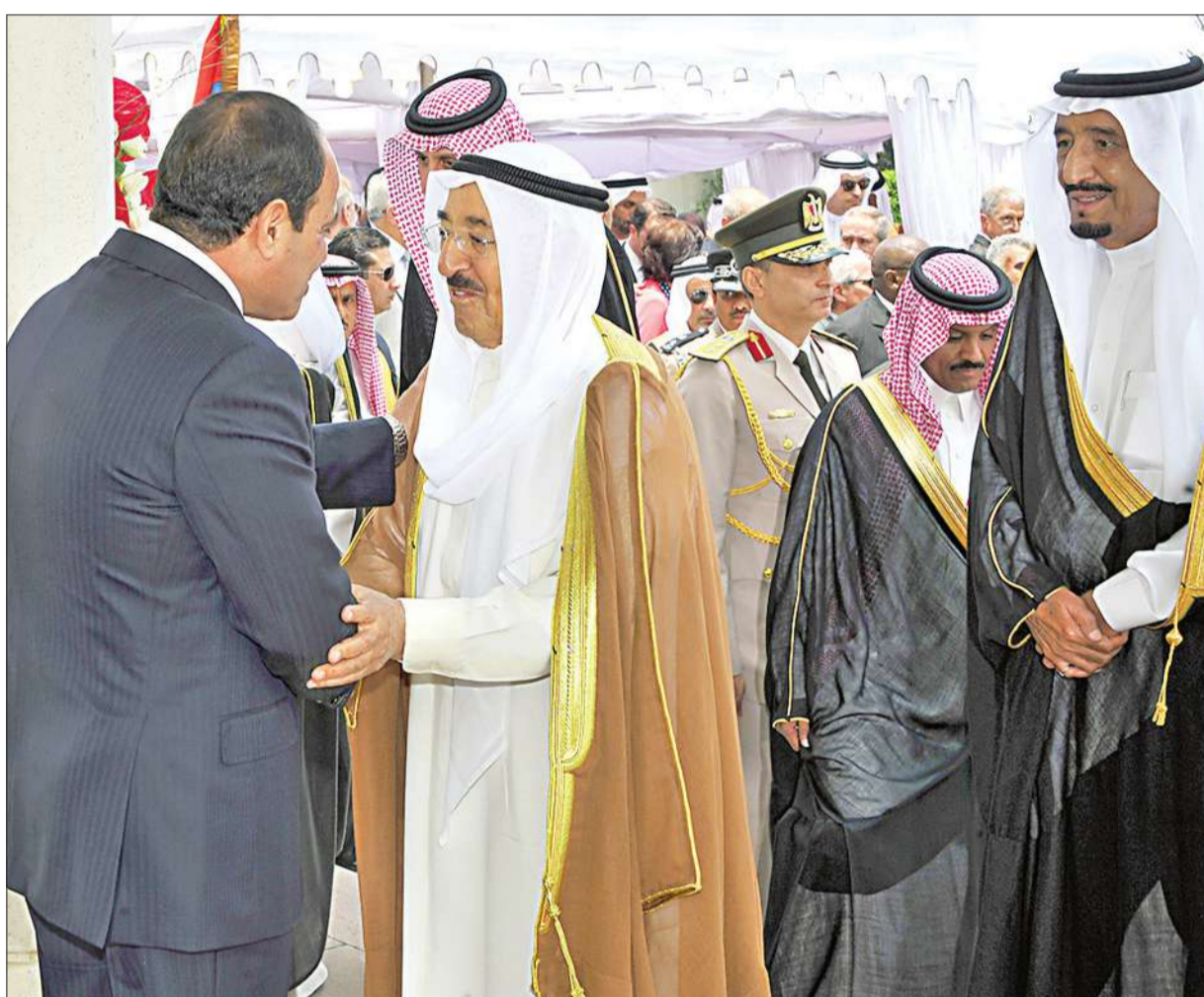
الأمير يهنئ الرئيس المصري بعد تنصيبه ويبدو ولي العهد السعودي وحشد الشخصيات المهنية

● الأمير يحضر مراسم «التسليم والتسلم»... ويجري مباحثات ثنائية مع المشير ● يوم احتفالي رسمي وشعبي طويل... والرئيس يتعهد بـ «قطف ثمار الثورتين»