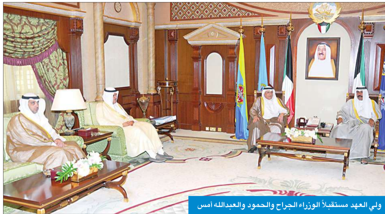
ولي العهد مستقبلاً الوزراء الجراح والحمود والسليمان

كما استقبل سموه نائب رئيس مجلس الوزراء وزير الدفاع الشيخ خالد الجراح ووزير الإعلام وزير الدولة لشؤون الشباب الشيخ سلمان الحمود ووزير الدولة لشؤون مجلس الوزراء وزير العدل بالوكالة الشيخ محمد عبدالله.