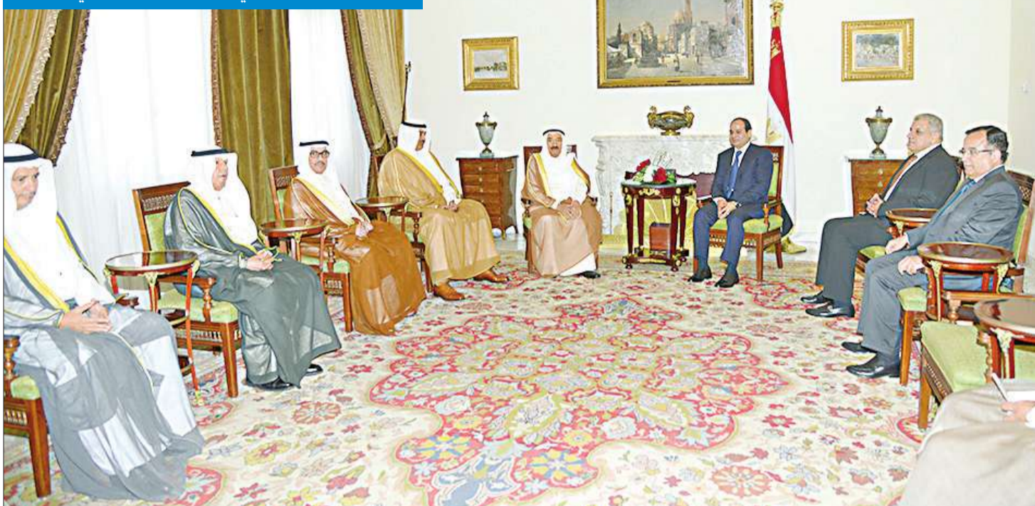
الأمير خلال لقاء السيسي بحضور الوفد الرسمي المرافق

وزير الخارجية الشيخ صباح الخالد، ومدير مكتب صاحب السمو أحمد الفهد، والمستشار بالديوان الأميري د. يوسف إبراهيم والمستشار بالديوان الأميري الفريق خالد بودي، ورئيس المراسم والتشريعات الأميرية الشيخ خالد عبدالله، فضلاً عن عدد من كبار المسؤولين في الديوان الأميري.