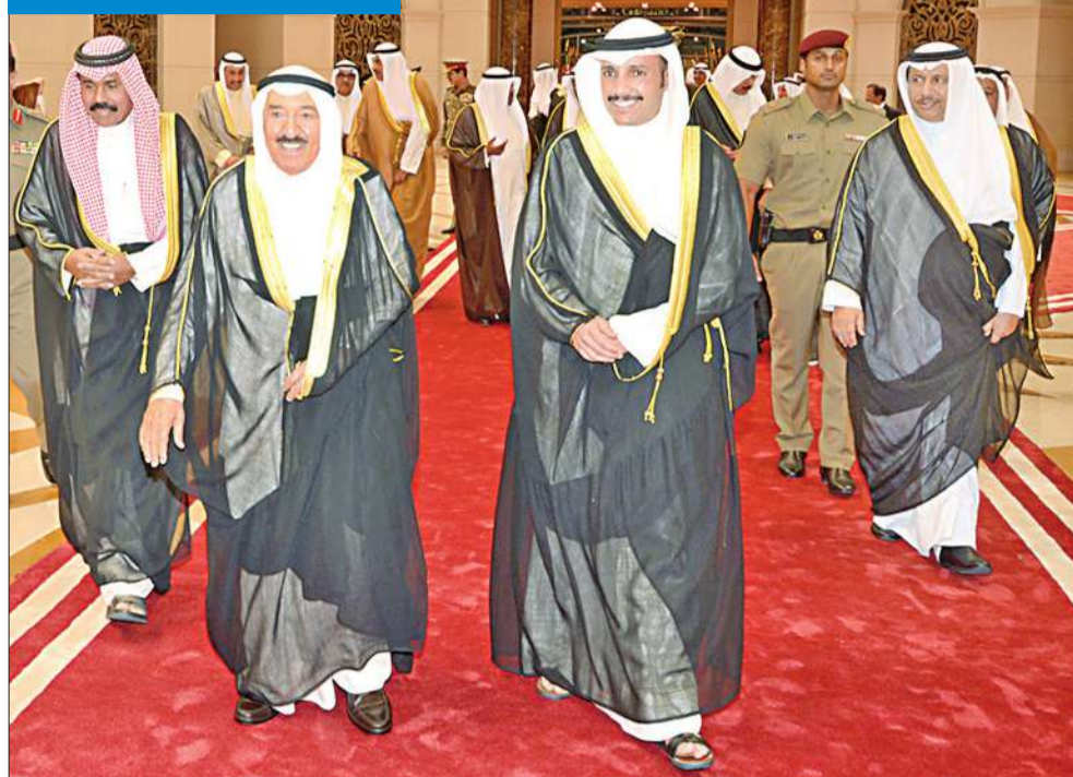
الأمير لدى عودته إلى البلاد أمس

توج سمو الأمير الشيخ صباح الأحمد زيارته للقاهرة أمس للمشاركة في مراسم تنصيب الرئيس المصري عبدالفتاح السيسي، ببقاء عقده سموه عصر أمس مع السيسي في المقر الدائم لثئاسة الجمهورية بالعاصمة القاهرة. وتم خلال اللقاء تبادل الأحاديث الودية والمشاعر الطيبة في جو ودي عكس روح الأخوة وعمق العلاقات التي تربط قيادة دولة الكويت وشعبها بإخوانهم في مصر، والعمل على تعزيز مسيرة