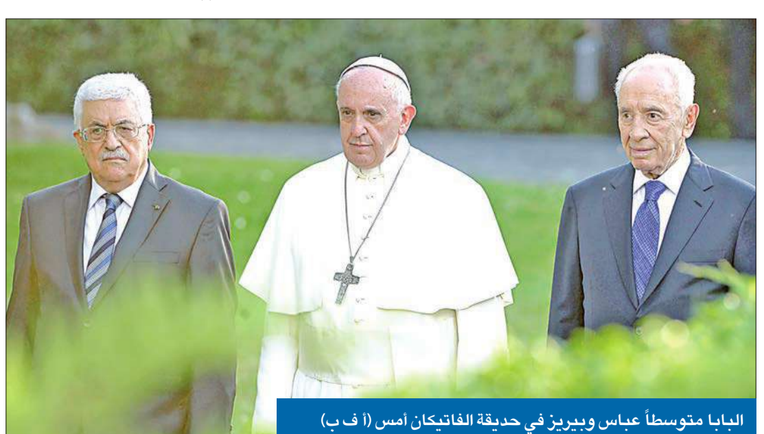
البابا متوسلاً عباس وبيريز في حديقة الفاتيكان أمس

ألقي الفاتيكان أمس بتقله الروحي من أجل أن يحل السلام في الأراضي المقدسة بين الفلسطينيين والإسرائيليين، حيث استضاف البابا فرنسيس أمس الرئيس الإسرائيلي شمعون بيريز، ورئيس السلطة الوطنية الفلسطينية محمود عباس في الفاتيكان في لقاء صلاة غير مسبوق. وأقيمت صلوات يهودية ومسيحية وإسلامية أمس في الفاتيكان، لتلقها مصافحة الزعماء بعضهم بعضاً، وقيامهم بغرس شجرة زيتون تعبيراً عن أملهم أن يحل السلام. وفي كلمة له، أمام الحشود في ساحة القديس بطرس قبل ساعات من الصلاة من أجل السلام، قال البابا إنه سوف «يتناشد الرب منحة السلام في الأراضي المقدسة والشرق الأوسط والعالم بأسره». واعتبر عباس دعوة الحبر الأعظم شجاعة، مضيفاً أنه «بهذه الصلوات، ترسل إشارة إلى جميع معتنقي الأديان الثلاثة السماوية، اليهودية والمسيحية والإسلام، وأيضاً من الأديان الأخرى، مفادها أن حلم السلام