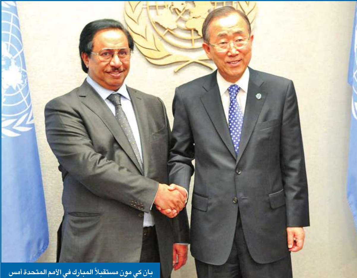
بان كي مون مستقبلاً المبارك في الأمم المتحدة أمس

تتجه الأناضول اليوم إلى ساحة الإرادة حيث التجمع المنعقد من «الأغلبية» و«نهج» تحت شعار لا خير فينا إن لم نقلها، الذي يأتي عشية إصدار المحكمة الدستورية حكمها في قضية الدوائر الخمس، في وقت لم يثمر جديداً اجتماع «الأغلبية» الذي عقد أمس الأول بديوان عضو المجلس المبطل بدر الداهوم الذي أكد أنه «لا جديد لدينا» مشدداً على أن الأهم هو إيصال رسالة إلى السلطة برفض تفردا وعيها بالدوائر.