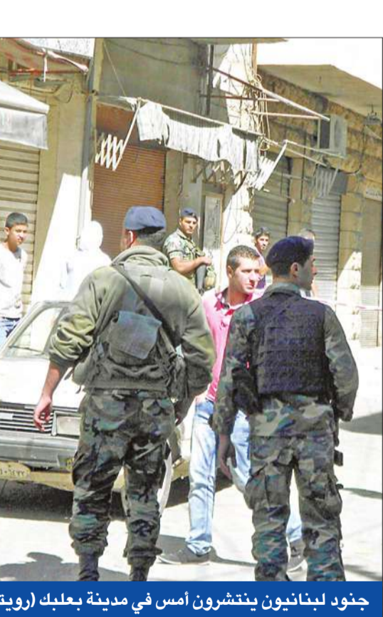
جنود لبنانيون ينتشرون أمس في مدينة بعلبك

أدى سقوط قذيفة مصدرها الجانب السوري من الحدود اللبنانية -السورية بالقرب من مركز للجيش اللبناني في بلدة النورة شمال لبنان إلى جرح ثلاثة عسكريين لبنانيين، سببها ذكرت وسائل الإعلام اللبنانية الرسمية أمس، إلى ذلك قدمت الحكومة الأردنية أمس احتجاجاً شديداً للسلطات السورية المختصة على سقوط قذيفة مساء الخميس الماضي على مسجد الفلاح قرب المدينة الصناعية في مدينة الرمثا الأردنية. وقال وزير الدولة لشؤون الإعلام الناطق الرسمي باسم الحكومة الأردنية محمد المومني إن وزارة الخارجية سلمت مذكرة إلى السفارة السورية في عمان أكدت فيها «ضرورة اتخاذ الإجراءات اللازمة لمنع تكرار مثل هذا الأمر في المستقبل».