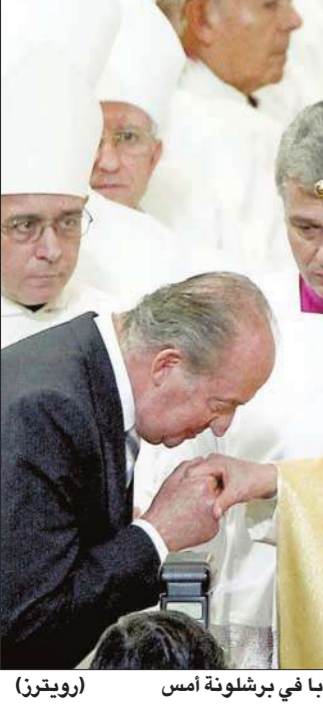
ملك إسبانيا خوان كارلوس مقلدا يد البابا في برشلونة أمس

أما المعارضة فتتقدم بشكل أساسي مع حزبين صغيرين، فحزب القوة الديمقراطية أنشأه المنشقون عن الرابطة الوطنية للديمقراطية الذين يعارضون المقاطعة. ويأتي ذلك في وقت وسعت حكومة خوسيه لويس ناباتيرو في الأونة الأخيرة الإطار الشرعي الذي يجيز الإجهاض، كما أنها شرعت في عام 2005 زواج مثلي الجنس. واعتبر البابا الذي كان يجني قداساً في برشلونة بمناسبة تكريس كنيسة العائلة المقدسة «سأغارد فاميليا»، المنصب الذي يُعتبر تحفة أعمال المهندس المعماري أنتونيو غودي والذي يرمز إلى القيم التقليدية للعائلة الكاثوليكية، أن على الدول أن تحمي الحياة في الحمل والولادة والنمو وصولاً إلى النهاية الطبيعية». ودعا البابا إلى «الدفاع عن حياة الأطفال منذ لحظة الحمل بهم باعتبارها مقدسة ولا يمكن انتهاكها»، وإلى أن يتم «تحفيز الولادات وإعطائها قيمة أكبر ودعمها