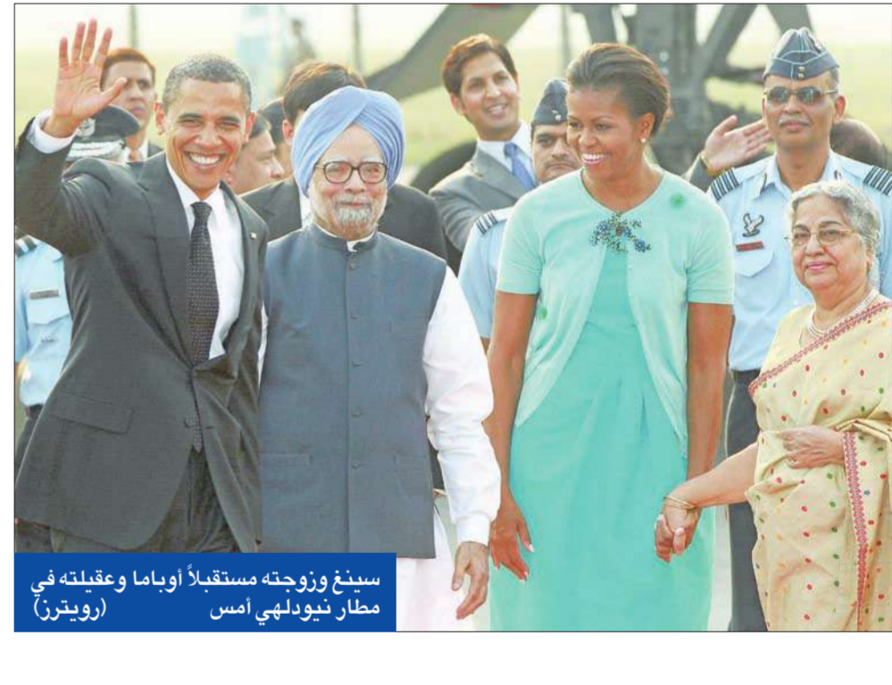
سينغ وزوجته مستقبلاً أوباما وعقيلته في مطار نيودلهي أمس

والأمن الإقليمي». وتابع بأنه سيكون هناك إعلانات الاقتصادية للهند مومباي، وصل الرئيس الأميركي باراك أوباما أمس، إلى نيودلهي لإجراء مباحثات مع القادة الهنود. ووصل أوباما وقرينته ميشال إلى مطار بالام في العاصمة الهندية حيث كان في استقبالهما رئيس الوزراء الهندي مانموهان سينغ وقرينته جورشاران كاور. وتجاوز سينغ في لفتة نادرة، البروتوكول الهندي واستقبل بنفسه زعيماً أجنبياً. وخلال ستة أعوام قضاها سينغ في المنصب، لم يستقبل إلا الرئيس الأميركي السابق جورج بوش والعاهل السعودي الملك عبدالله بن عبدالعزيز شخصياً. ومن المقرر أن يجري أوباما محادثات مع سينغ اليوم، بلقي بعدها كلمة أمام جلسة مشتركة للبرلمان الهندي بمجلسيه. وقال أوباما في مومباي قبل مغادرتها: «سأبحث بالتفصيل سيل توسيع وتعزيز التعاون بين البلدين كما ستكون هناك بعض الإعلانات حول قضايا مهمة مثل مكافحة الإرهاب