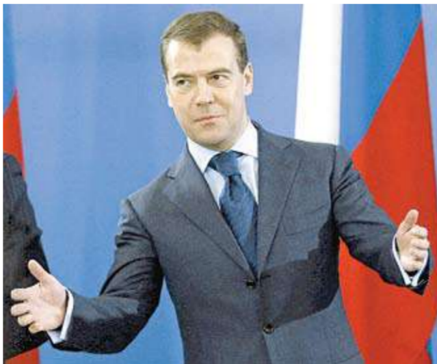
ميدفيديف يتحدث خلال زيارته إلى مصنع للتقنيات البيولوجية في مدينة روماشيفو أمس

الشخص الذي يمكن أن يترشح لولاية مقبلة أو تاريخ حصول هذا الأمر. (موسكو - أ ف ب، رويترز، يو بي آي)