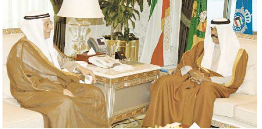
نائب الأمير مستقبلاً خالد الصالح

استقبل سمو نائب الأمير وولي العهد الشيخ نواف الاحمد في ديوانه بقصر السيف صباح أمس خالد عيسى الصالح.