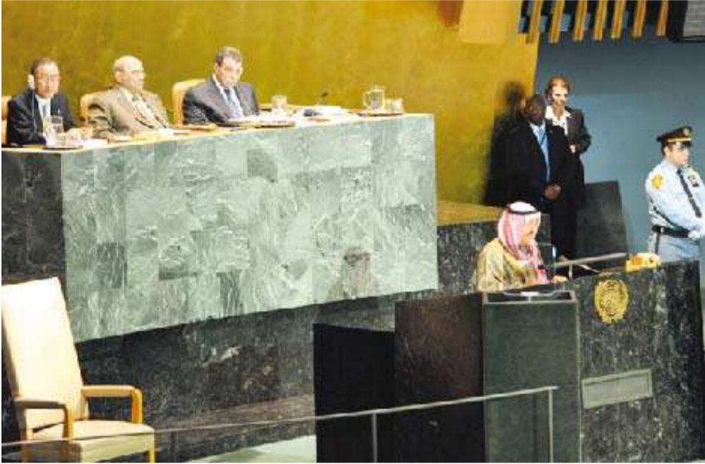
الأمير يلقي كلمته حول حوار الأديان في الأمم المتحدة

دون عقد أو خوف، منطلقين من حقيقة أننا جميعاً نؤمنون على مقدرات البشرية وتنميتها لصالح الإنسان. السيد الرئيس، لعل البداية الضرورية للسلوك في هذا الطريق تأتي من خلال الحوار بين قادة الفكر من أتباع الأديان السماوية والمعتقدات الأخرى، والذي أصبح الآن جزءاً من المشهد السياسي، فالأمم المتحدة مثلاً ساهمت في خلق الأجواء المناسبة لذلك، فأصدرت الجمعية العامة للأمم المتحدة قرارها باعتبار عام 2001 عاماً للحوار بين الحضارات، ومواجهة حملات الكراهية، وتاجيح الصراع، كما أن الأمم المتحدة أصدرت قراراً آخر باعتبار عام 2010 عام التقارب بين الثقافات. السيد الرئيس، ان التحليل السليم لأسباب المآسي التي مرت بها البشرية لم يكن باي حال من الأحوال بسبب المعتقدات الدينية، أو القيم الثقافية، إنما كان بسبب نهج التطرف والتعصب والتمييز، الذي ابتلى به بعض أتباع الأديان السماوية والمعتقدات الأخرى. ان الأديان السماوية في جوهرها ونهجها وتعاليمها تقدم الحلول للمشاكل التي تواجه البشرية، وليست هي باي حال من الأحوال سبباً في تلك المشاكل، وبالتالي فعلى رجال الدين والمثقفين من كل الديانات مسؤوليات في إبراز تلك الحقائق، والمساعدة على تصحيح المفاهيم الخاطئة في أذهاننا كما أن على رجال الفكر، والتعليم والتربية خلق وعي لدى الناشئة وصقلهم لاحترام المعتقدات