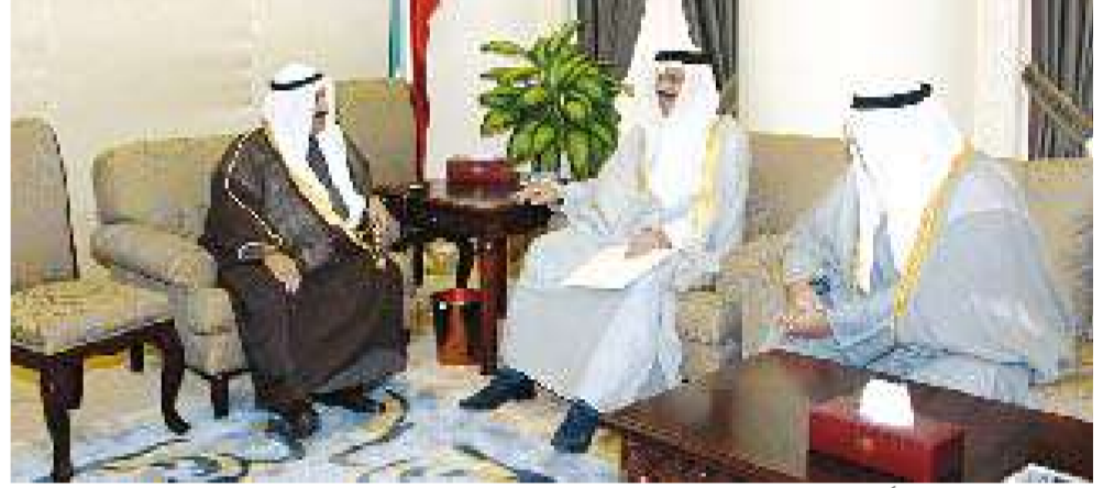
ناصر محمد مستقبلاً السفير القطري

استقبل سمو رئيس مجلس الوزراء الشيخ ناصر محمد أمس سفير قطر لدى الكويت عبدالعزيز بن سعد الفهيد، حيث سلم سموه رسالة خطية من سمو رئيس مجلس الوزراء وزير الخارجية في دولة قطر الشيخ حمد