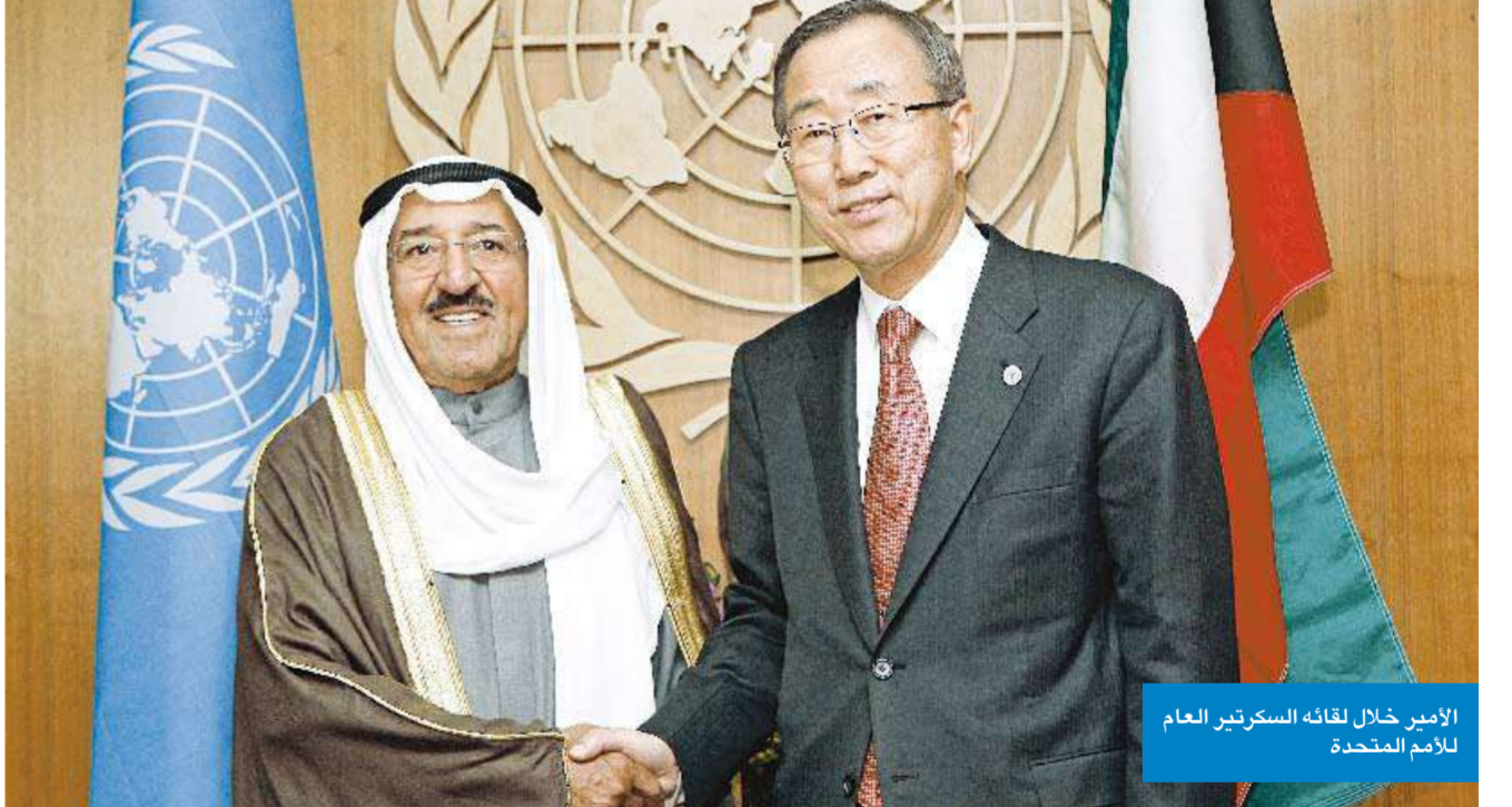
الأمير خلال لقائه السكرتير العام للأمم المتحدة

«سموه وبان كي مون بحثاً دور المنظمة في المنطقة والتواصل بين الشعوب»