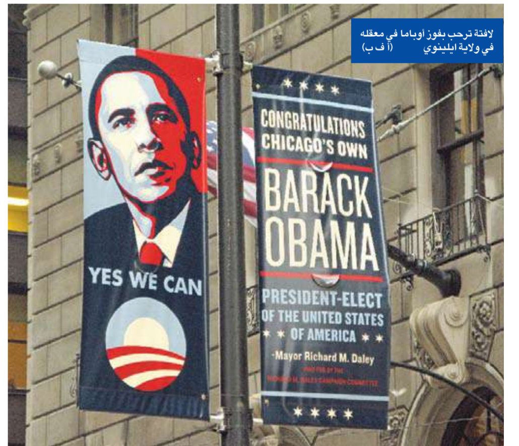
لافتة ترحب بفوز أوباما في معقله في ولاية إلينوي

ومن بين الأسماء التي تتردد في الصحافة لشغل منصب وزير الخارجية في الإدارة المقبلة اسم المرشح الديمقراطي السابق في انتخابات الرئاسة جون كيري، وحاكم ولاية نيومكسيكو (جنوب غرب) والمندوب السابق في الأمم المتحدة بيل ريتشاردسون.