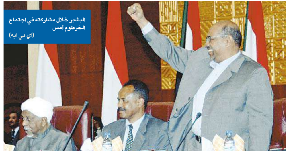
البشير خلال مشاركته في اجتماع الخرطوم أمس

القاهرة - أسماء الحسيني ورفيدة ياسين في خطوة اعتبرها البعض نتيجة مباشرة لزيارة الرئيس المصري حسني مبارك للسودان، أعلن الرئيس السوداني عمر البشير أمس وقفاً «فورياً» وغير مشروط، لإطلاق النار في منطقة دارفور، بينما رفضت «حركة العدل والمساواة» المتحذرة الإعلان، واشترطت التوصل إلى اتفاق شامل أولاً. وقال البشير، الذي يواجه تهماً من المحكمة الجنائية الدولية بارتكاب جرائم حرب في دارفور، إنه سيشن حملة فورية لنزع سلاح الميليشيات، وتقيد استخدام القوات المسلحة للسلاح». «