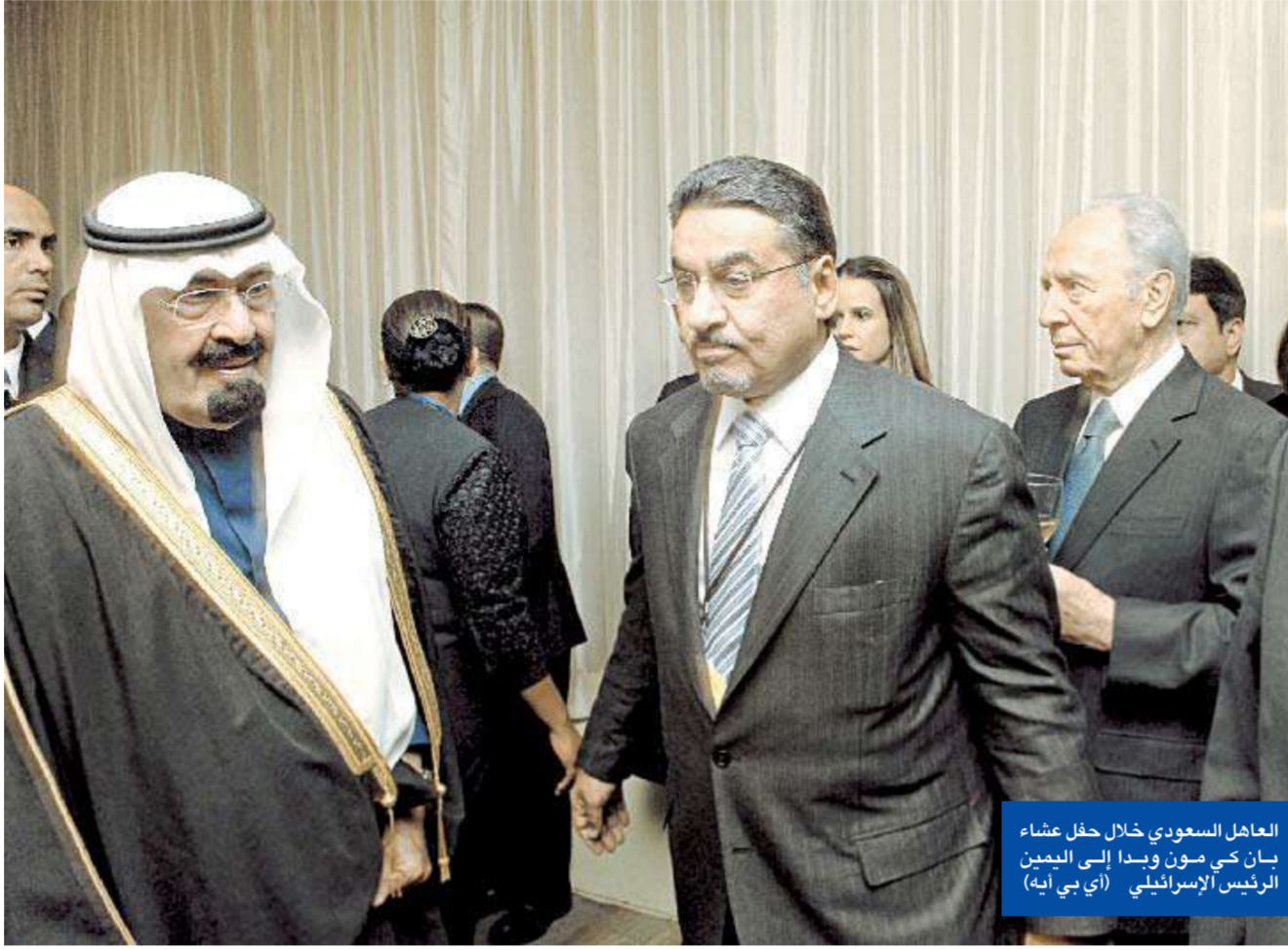
العاهل السعودي خلال حفل عشاء بان كي مون وبيدا إلى الأمين الرئيس الإسرائيلي

العاهل السعودي يدعو إلى «إعلان تاريخي لنبذ الصراع على أساس الدين»