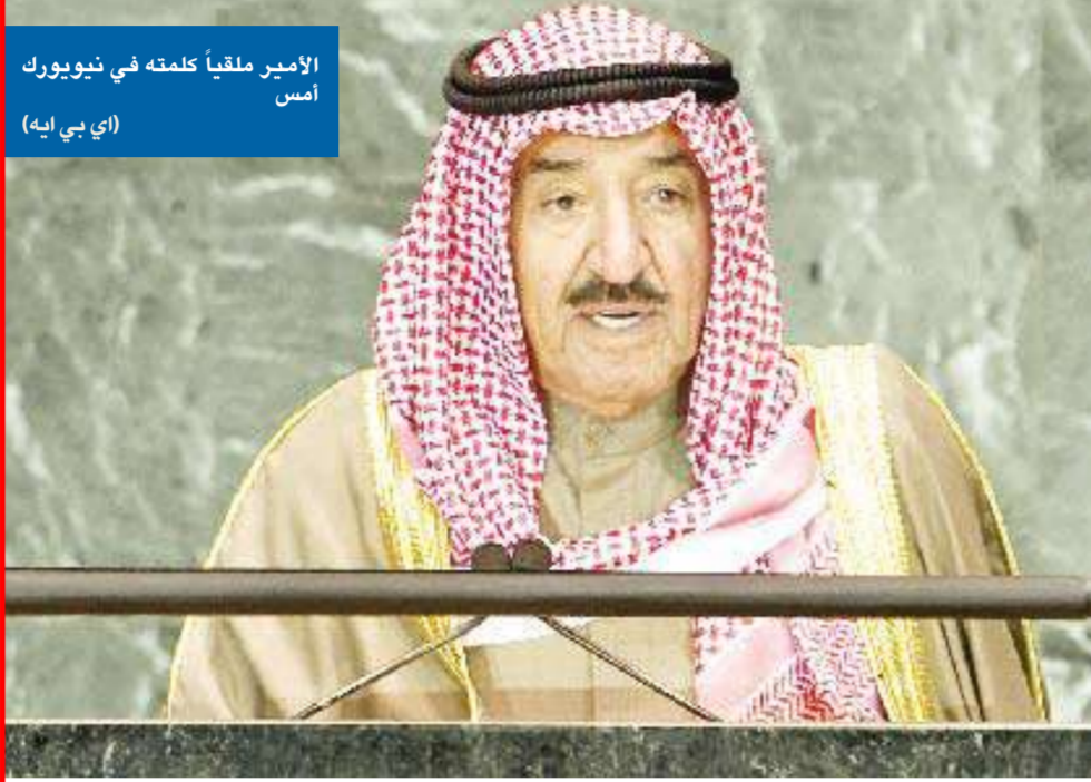
الأمير ملكياً كلمته في نيويورك أمس

أكد سمو أمير البلاد الشيخ صباح الأحمد ضرورة تحويل ثقافة العالم «من ثقافة كره وتعصب وحرب إلى ثقافة حوار وتعايش وجوداً وفكراً». مبيناً أن «سبيلنا لذلك هو الإيجابية في التعامل والتفاعل بعضاً مع بعض دون عقد أو خوف منطلقين من حقيقة أننا جميعاً مؤمنون على مقدرات البشرية وتنميتها لصالح الإنسان». وشدد سموه في كلمة القاها أمس خلال الاجتماع الرفيع المستوى للجمعية العامة للأمم المتحدة لبحث