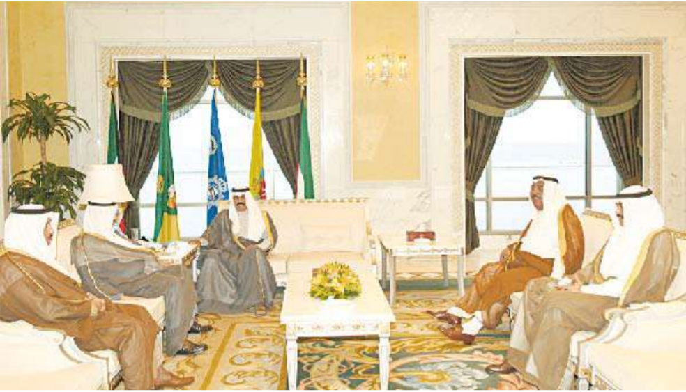
ولي العهد مستقبلاً ناصر المحمد والوزراء

استقبل سمو نائب الأمير وولي العهد الشيخ نواف الاحمد في ديوانه بقصر السيف صباح امس رئيس مجلس الامة جاسم الخرافي، كما استقبل سموه سمو رئيس مجلس الوزراء ناصر المحمد والنائب الاول لرئيس مجلس الوزراء وزير الدفاع الشيخ جابر المبارك ووزير الداخلية الشيخ جابر الخالد ووزير الاعلام وزير الخارجية وزير الدولة لشؤون مجلس الوزراء بالانابة الشيخ صباح الخالد. واستقبل سموه رئيس وزراء العراق الاسبق اباد علاوي والوفد المرافق له بمناسبة زيارته للبلاد، وقد تم خلال اللقاء بحث عدد من القضايا ذات الاهتمام المشترك الشقيقين، متمنيا سموه للعراق وشعبه الشقيق الامن والاستقرار. حضر المقابلة المستشار بديوان سمو رئيس مجلس الوزراء رئيس بعثة الشرف د. اسماعيل الشطي