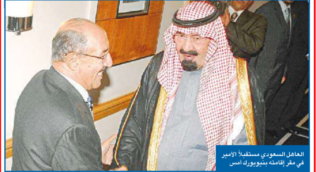
العاهل السعودي مستقبلاً الأمير في مقر إقامته بنيويورك أمس