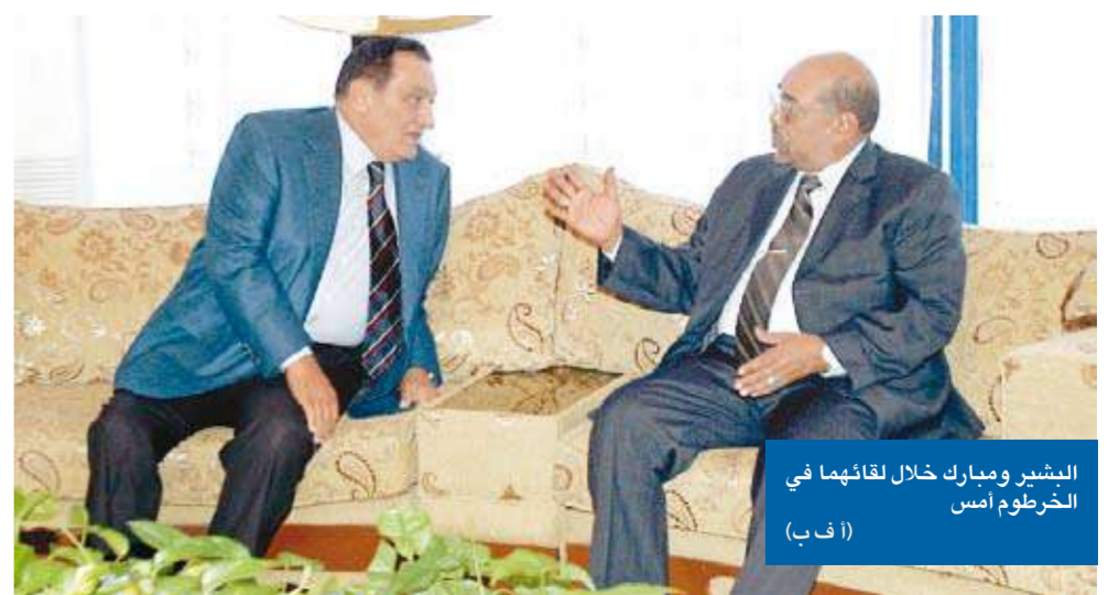
البشير ومبارك خلال لقاءهما في الخرطوم أمس

وتوجه مبارك إلى مدينة جوبا عاصمة جنوب السودان، في أول زيارة لرئيس عربي للمنطقة منذ زيارة الرئيس المصري الراحل جمال عبدالناصر عام 1962، حيث التقى النائب الأول للرئيس السوداني سيلفا كير وتباحثا حول 02