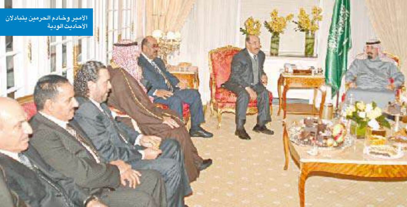
الامير وخادم الحرمين يتبادلان الاحاديث الودية

وحضر سمو امير البلاد الشيخ صباح الاحمد والوفد الرسمي المرافق لسموه مادية عشاء اقامها خادم الحرمين الشريفين في مقر اقامته بمدينة نيويورك.