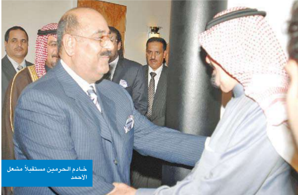
خادم الحرمين مستقبلاً مشعل الاحمد

اشاد رئيس دولة الامارات العربية المتحدة الشيخ خليفة بن زايد ال نهيان بالعلاقات الكويتية الاماراتية، واصفا اياها بـ «المتميّزة والتاريخية».